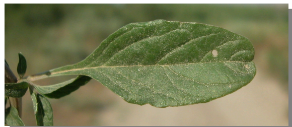
A. muricatus . Detalle de hoja no linear: haz