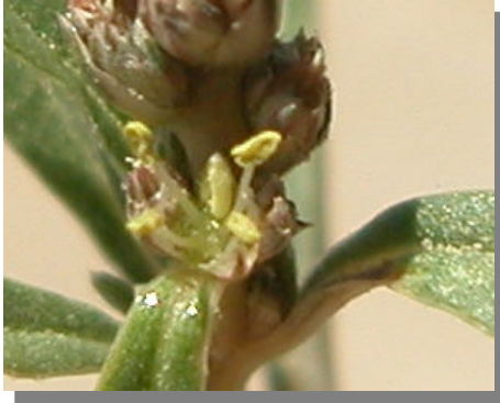
A. muricatus . Detalle de una flor