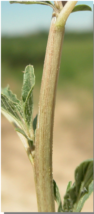
A. muricatus . Detalle del tallo