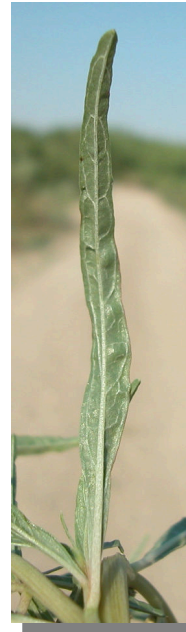
A. muricatus . Detalle de hoja linear: envés