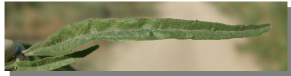
A. muricatus . Detalle de hoja linear: haz