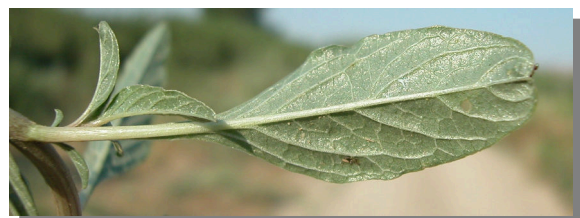
A. muricatus . Detalle de hoja no linear: envés