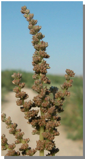
A. muricatus . Detalle de una espiga con frutos