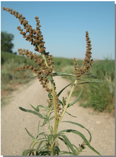
A. muricatus . Detalle de una rama