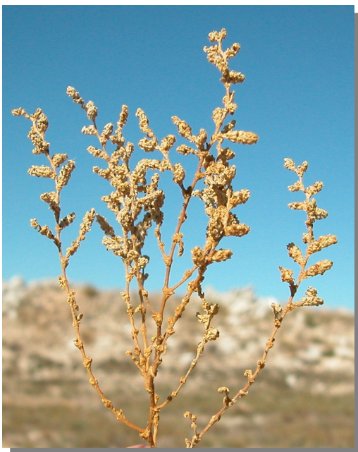
H. amplexicaulis . Detalle de ramas con inflorescencias maduras