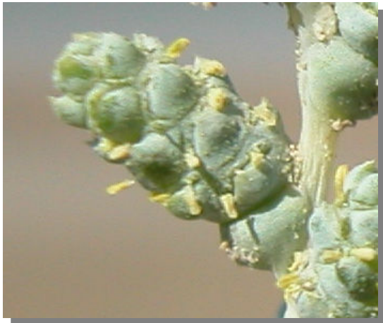
H. amplexicaulis . Detalle de inflorescencia