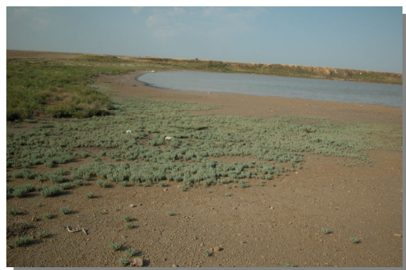
H. amplexicaulis en Salada de Guallar