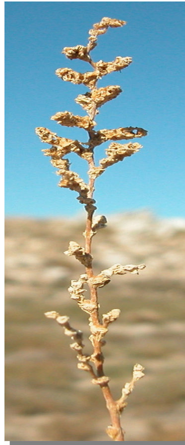
H. amplexicaulis . Detalle de rama con inflorescencias maduras