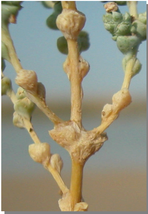
H. amplexicaulis . Detalle del tallo