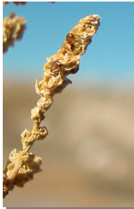
H. amplexicaulis . Detalle de inflorescencia madura con semillas