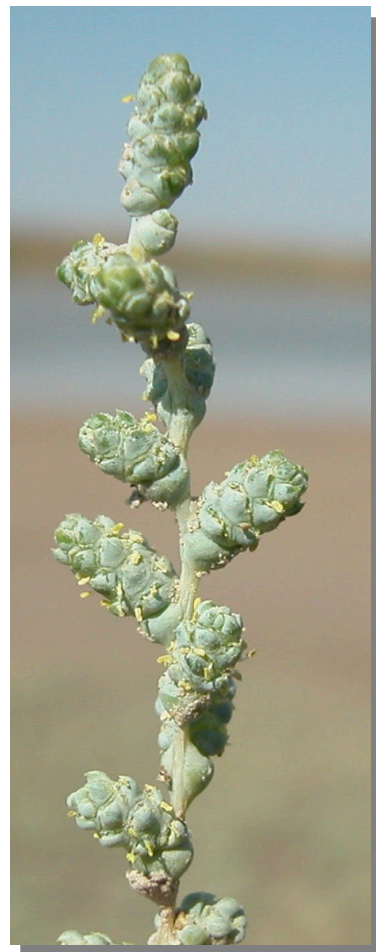
H. amplexicaulis . Detalle de rama con inflorescencias.