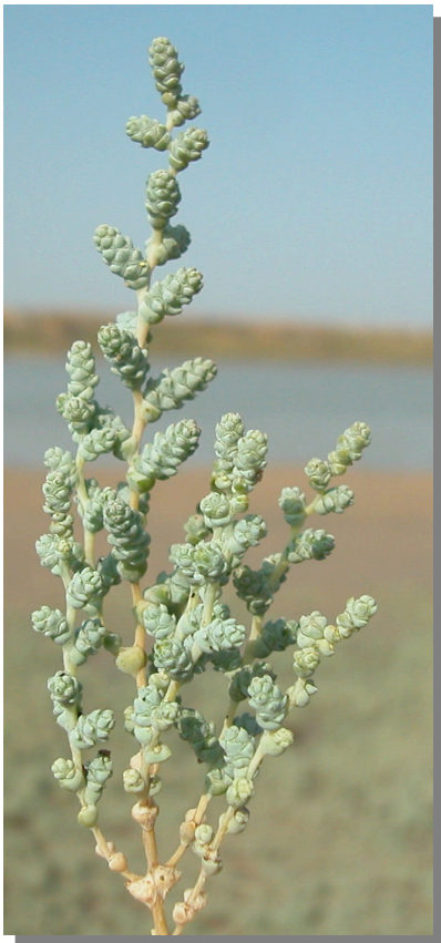
H. amplexicaulis . Detalle de inflorescencias con flores incipientes.