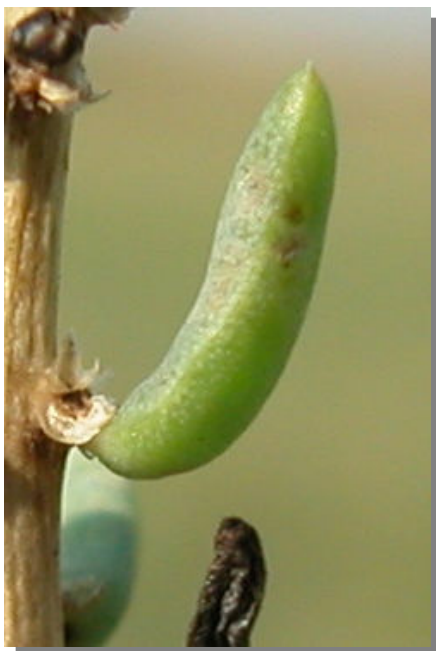
S. vera . Detalle de la hoja