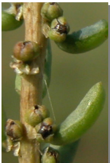
S. vera . Detalle de frutos