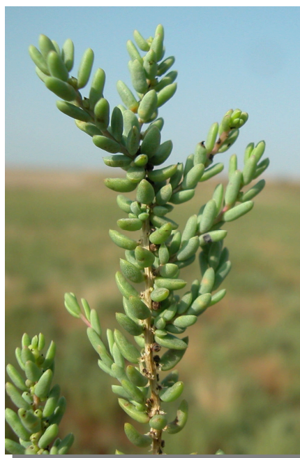
S. vera . Detalle del tallo y hojas