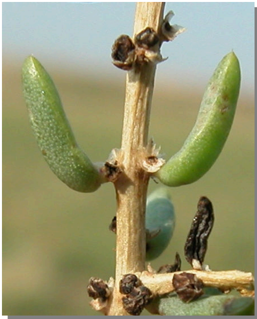
S. vera . Detalle del tallo y hojas