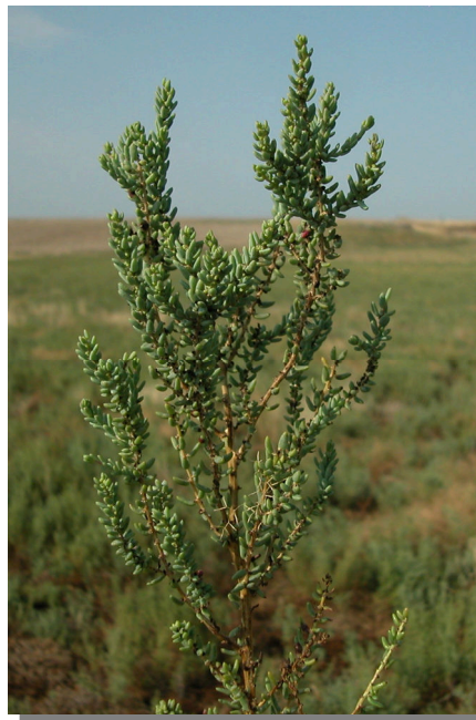
S. vera . Detalle del tallo y hojas