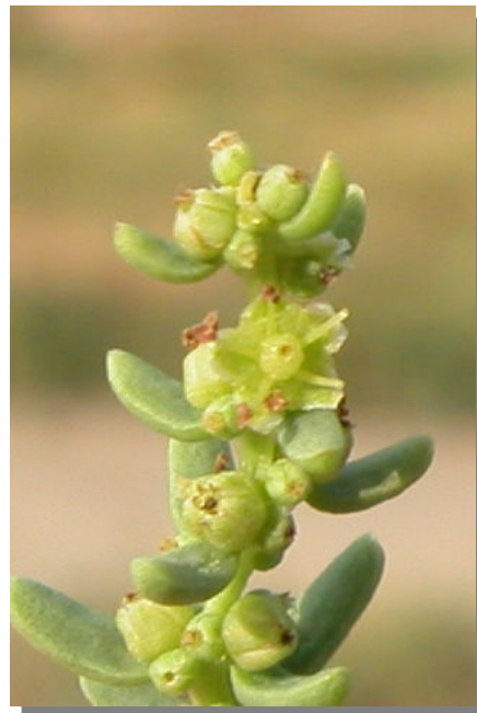
S. vera . Detalle de rama florífera