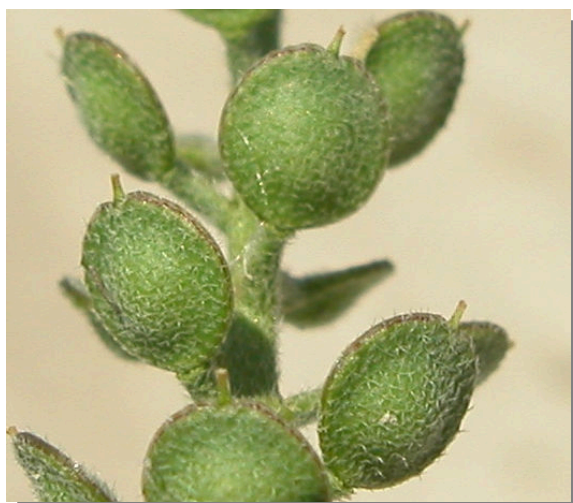
A. simplex . Detalle de frutos