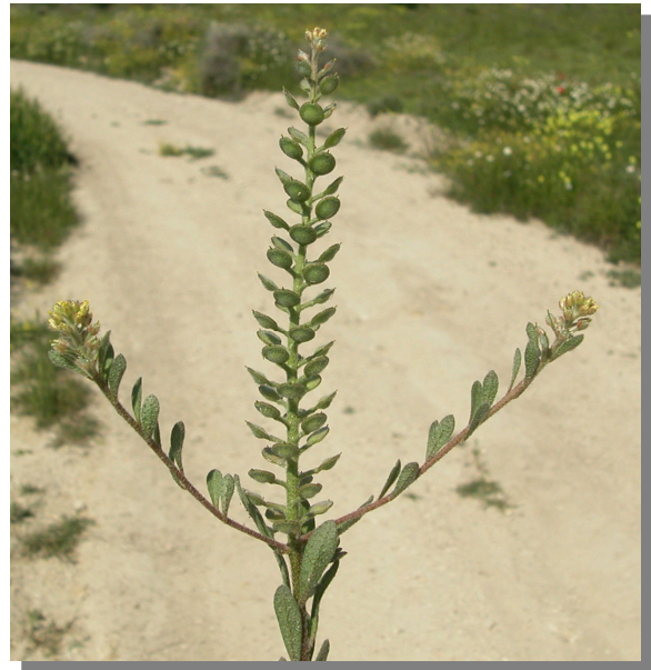
A. simplex . Detalle de tallos con flores y frutos