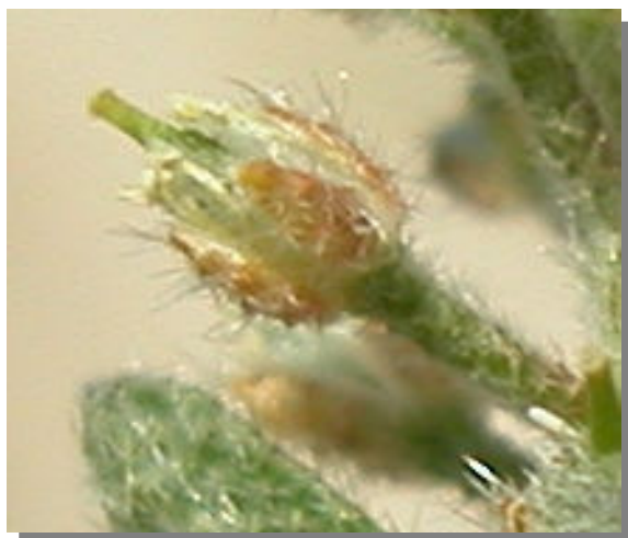
A. simplex . Detalle de sépalos