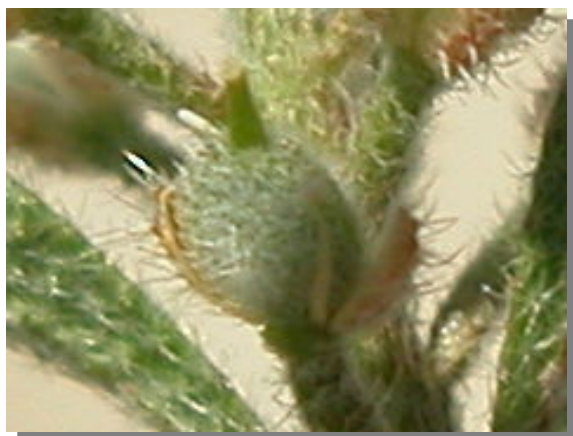
A. simplex . Detalle de sépalos cayendo