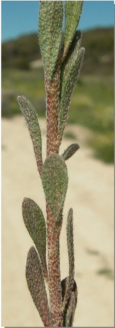
A. simplex . Detalle del tallo con hojas.