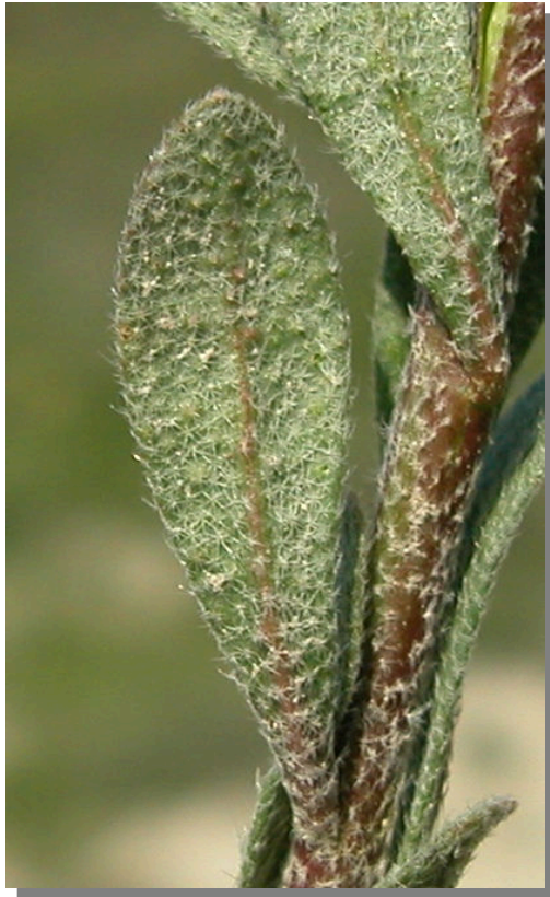
A. simplex . Detalle de la hoja: envés