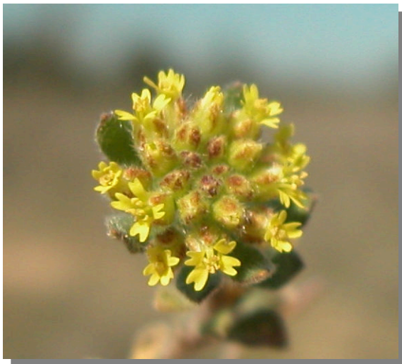
A. simplex . Detalle del racimo floral