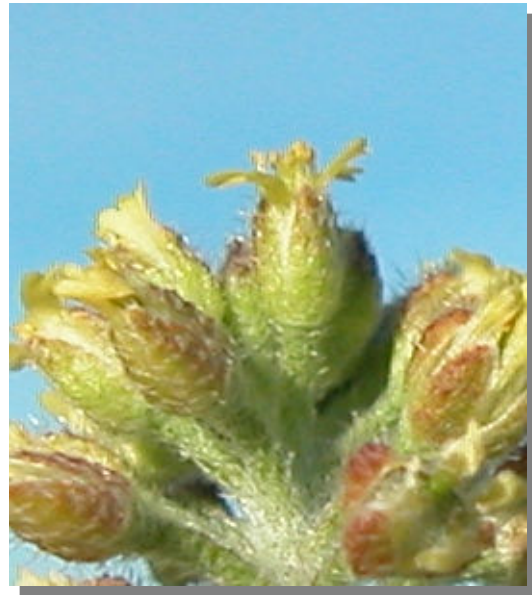
A. simplex . Detalle de una flor