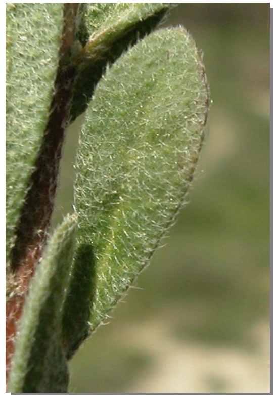
A. simplex . Detalle de la hoja: haz.