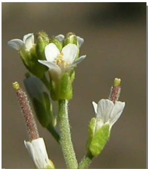
A. auriculata . Detalle de la flor