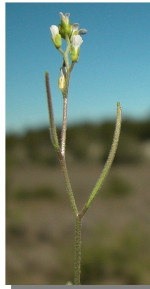
A. auriculata . Detalle del tallo con flores y frutos

A. prvula . Detalle del fruto y hojas caulinares no auriculadas.