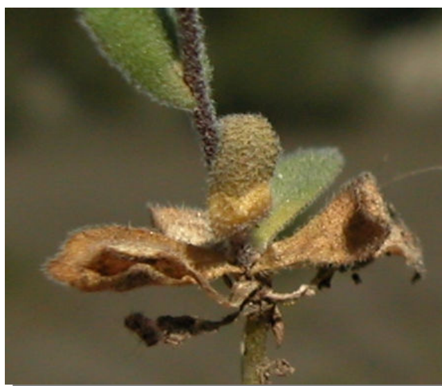
A. auriculata . Detalle de las hojas basales en la fructificación