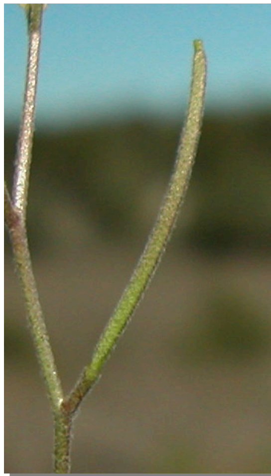
A. auriculata . Detalle del fruto