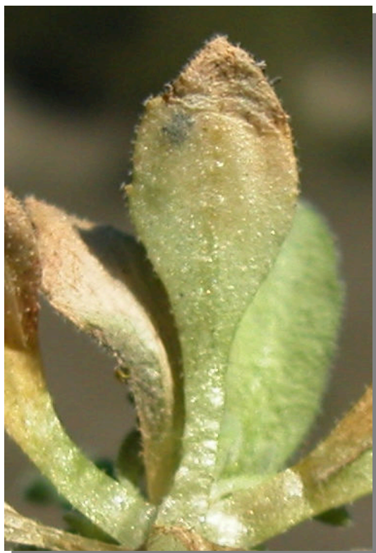
A. auriculata . Detalle de hoja inferior: envés