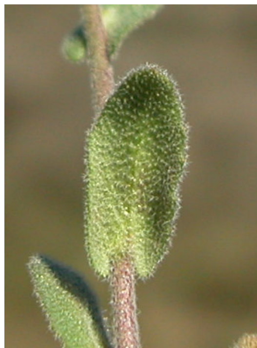
A. auriculata . Detalle de hoja superior: envés