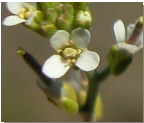
A. auriculata . Detalle de la corola