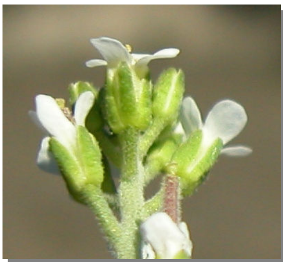
A. auriculata . Detalle del cáliz