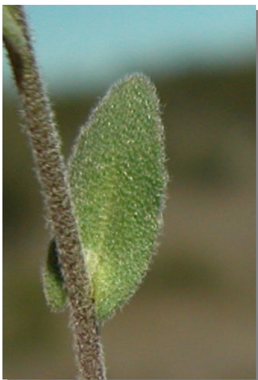
A. auriculata . Detalle de hoja superior: haz.