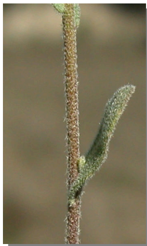
A. auriculata . Detalle del tallo con hojas.