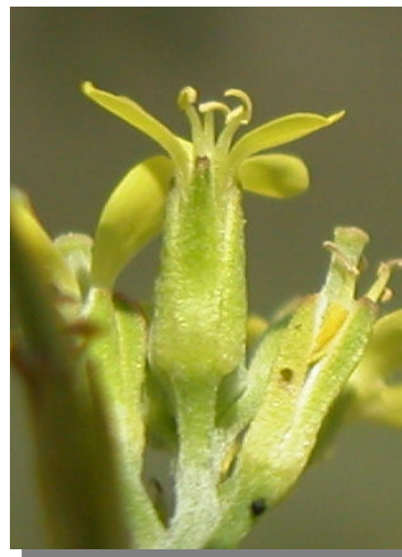
E. incanum . Detalle de los sépalos