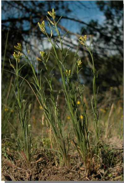
La Retuerta de Pina; Pina de Ebro (22/04/2015)