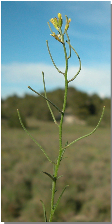
E. incanum . Detalle de la inflorescencia