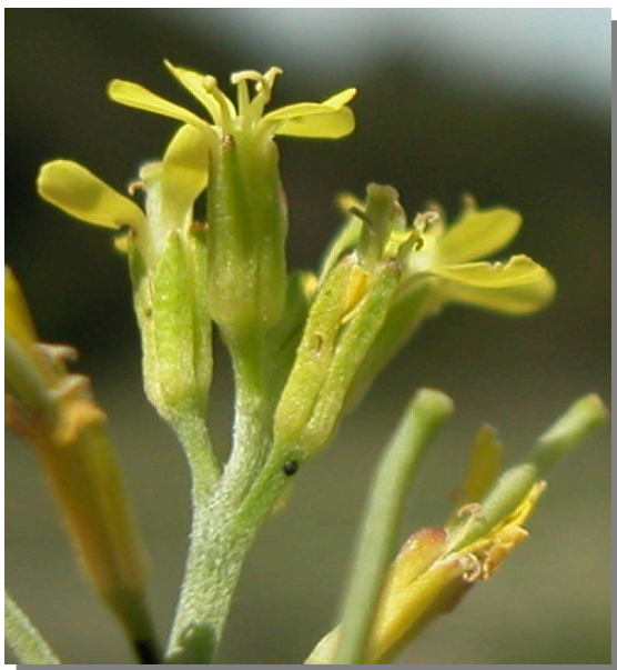
E. incanum . Detalle de la flor