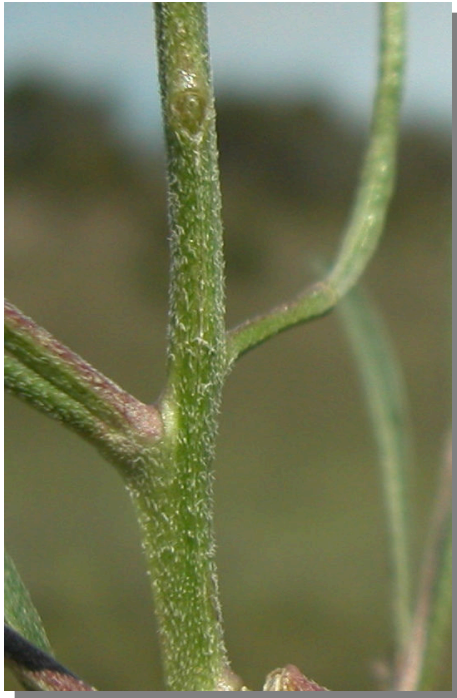
E. incanum . Detalle del tallo