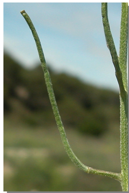
E. incanum . Detalle del fruto.