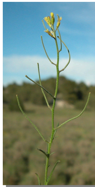
E. incanum . Flores amarillas pequeñas y frutos con pedicelos cortos.

Pedicelo corto, de 3 a 6 mm, poco más delgado que el fruto.