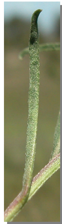
E. incanum . Detalle de hojas superiores