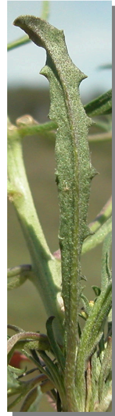
E. incanum . Detalle de hojas basales