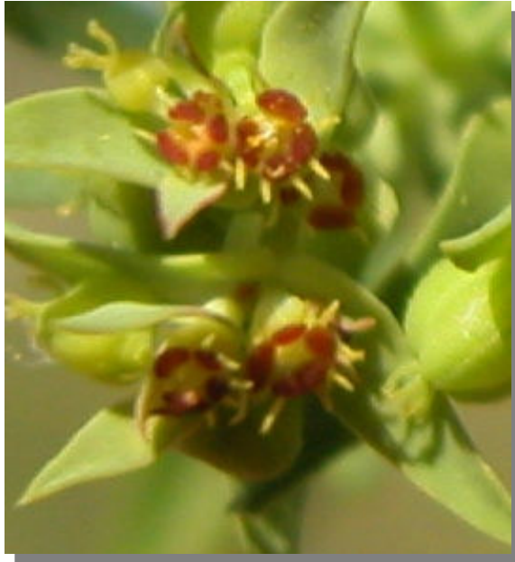
E. exigua . Detalle de la flor