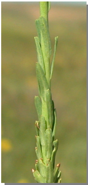
E. exigua . Detalle del tallo.