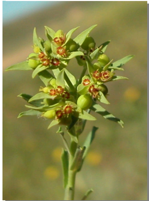
E. exigua . Detalle de la inflorescencia