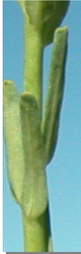
E. exigua . Detalle de las hojas

Oxicesta serratae (Lepidoptera). Planta nutricia