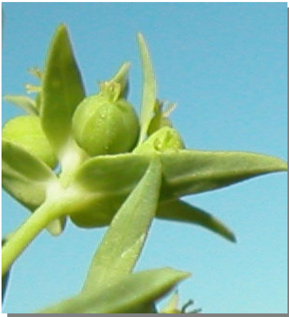
E. exigua . Detalle del fruto