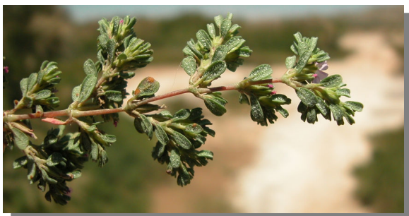
F. pulverulenta . Detalle de rama parte posterior