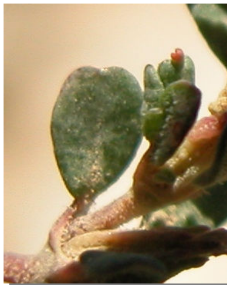
F. pulverulenta . Detalle de hoja: haz