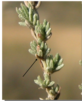
F. thymifolia . Detalle de las hojas.

El tener hojas planas y no ser leñosa diferencia a esta especie de Frankenia thymifolia , que es arbustiva y tiene hojas lineares con el margen revoluto