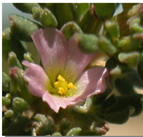
F. pulverulenta . Detalle de la corola