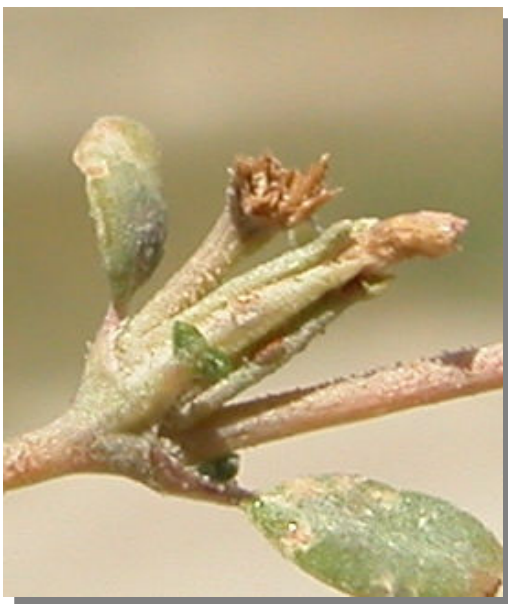
F. pulverulenta . Detalle del fruto