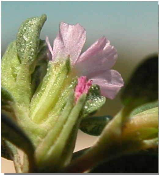
F. pulverulenta . Detalle del cáliz