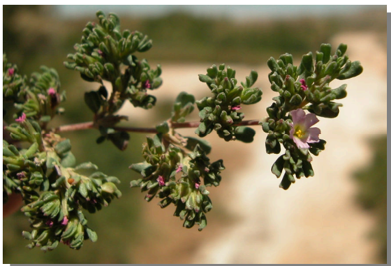
F. pulverulenta . Detalle de rama parte anterior