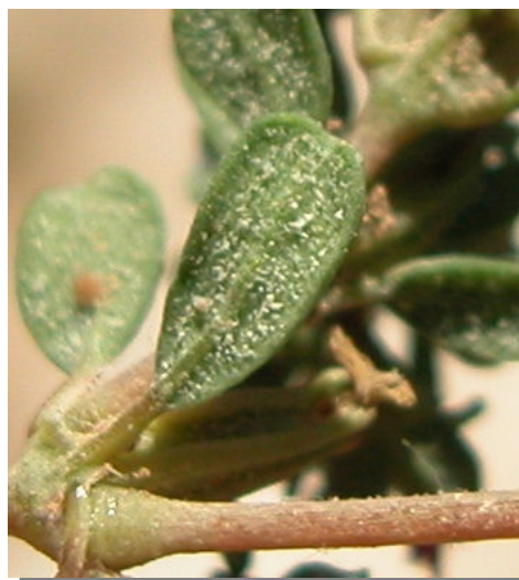
F. pulverulenta . Detalle de hoja: envés