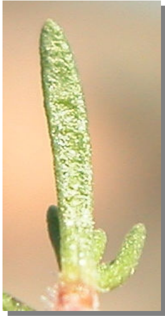
T. loscosii . Detalle de una hoja: envés