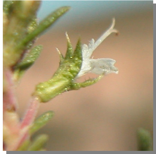
T. loscosii . Detalle del cáliz