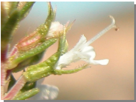
T. loscosii . Detalle de una flor