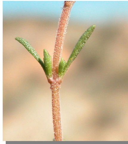
T. loscosii . Detalle del tallo y hojas

T. zygis . Cáliz mayor de 4 mm con dientes superiores menores de 1 mm.