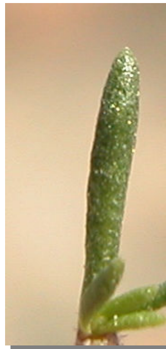
T. loscosii . Detalle de una hoja: haz