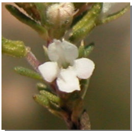
T. loscosii . Detalle de la corola