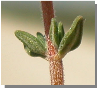
T. vulgaris . Hojas sin pelos