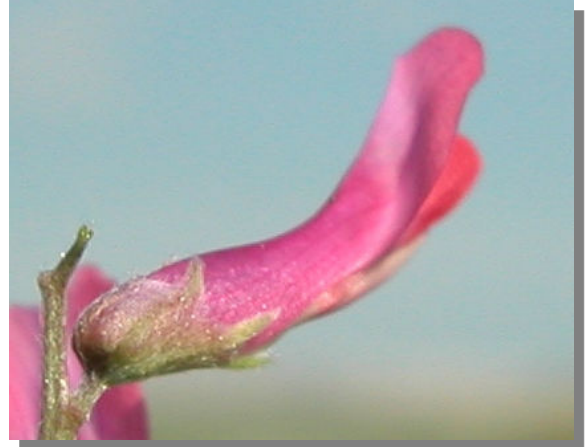
V. tetrasperma . Detalle del cáliz