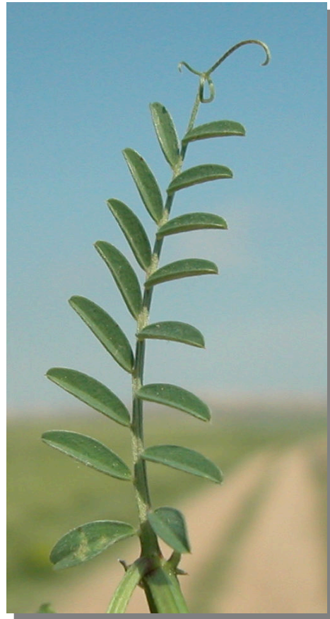
V. tetrasperma . Detalle de la hoja: haz.