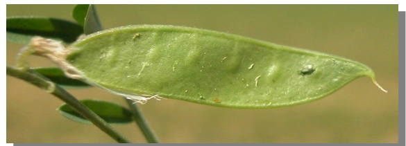
V. tetrasperma . Detalle del fruto