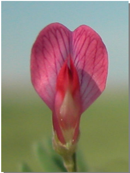
V. tetrasperma . Detalle de la corola