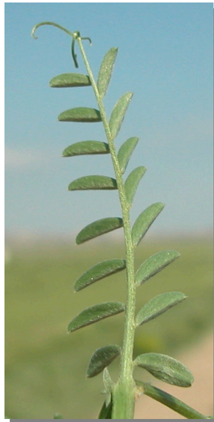
V. tetrasperma . Detalle de la hoja: envés