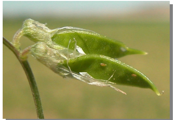
V. tetrasperma . Detalle del fruto