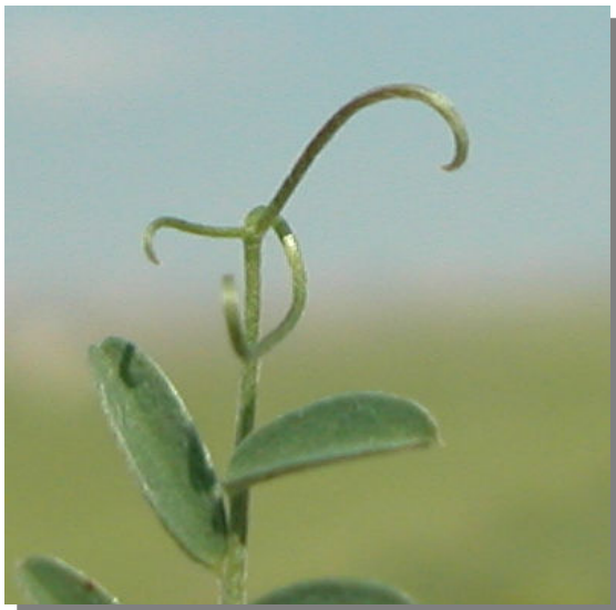
V. tetrasperma . Detalle del zarcillo