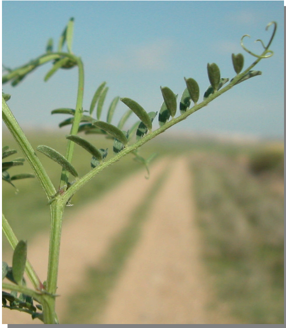
V. tetrasperma . Detalle del tallo con hoja