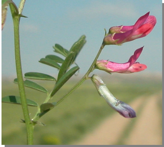
V. tetrasperma . Detalle de la inflorescencia