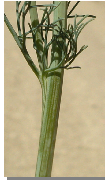
P. tenuiloba . Detalle del tallo