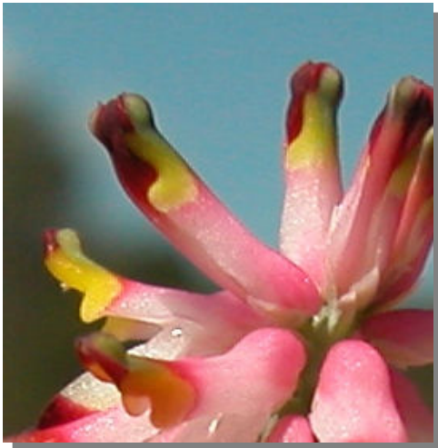
P. tenuiloba . Detalle de la flor