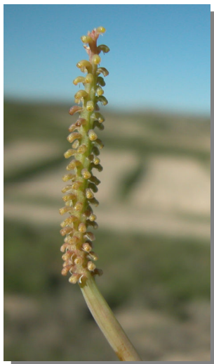
P. tenuiloba . Detalle de los frutos