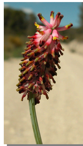
P. tenuiloba . Detalle de la inflorescencia