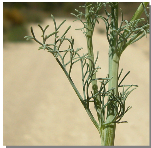
P. tenuiloba . Detalle de las hojas