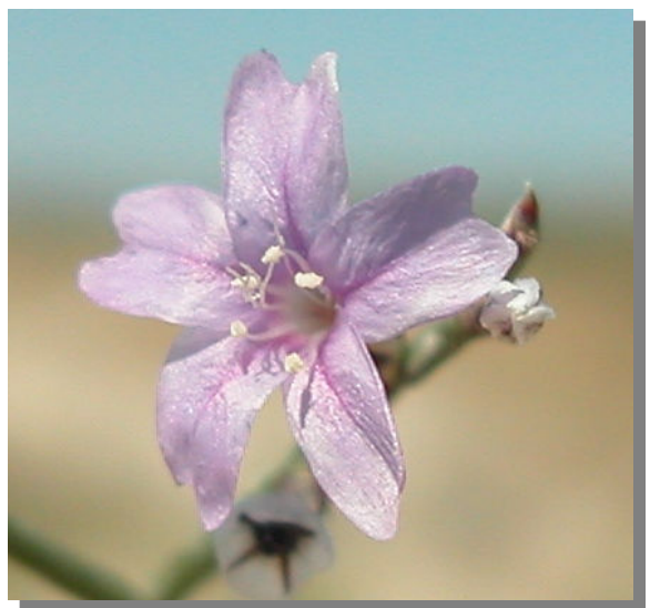
L. hibericum . Detalle de la corola