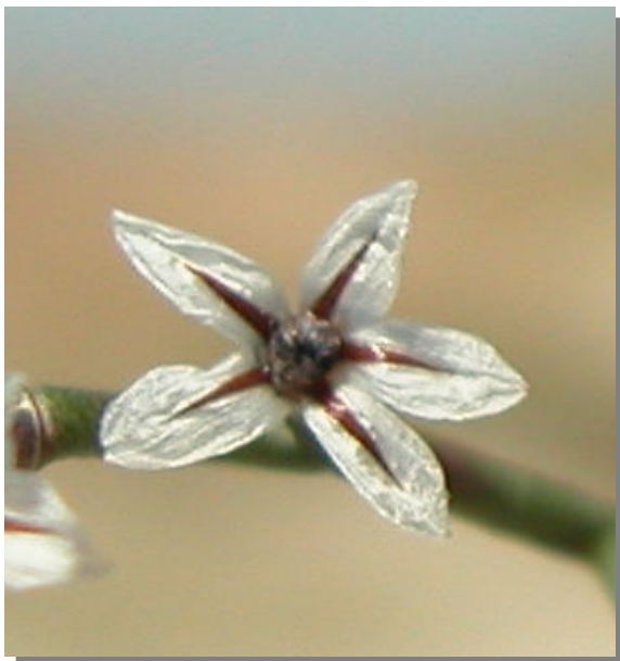
L. hibericum . Detalle del cáliz