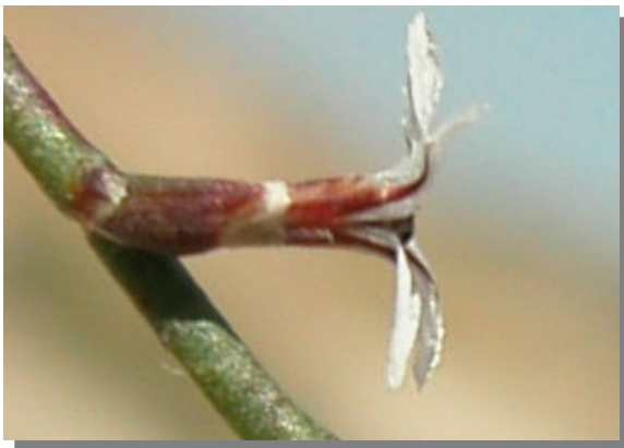
L. hibericum . Detalle del cáliz