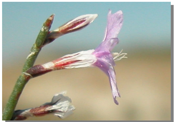
L. hibericum . Detalle de la flor