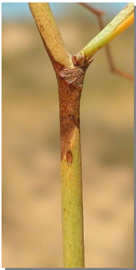
L. hibericum . Detalle del tallo