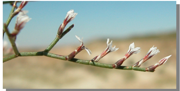
L. hibericum . Detalle de rama fértil