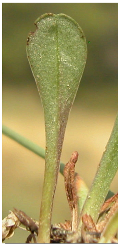
L. hibericum . Detalle de la hoja antes de la floración: envés