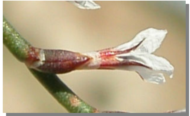
L. hibericum . Detalle del cáliz