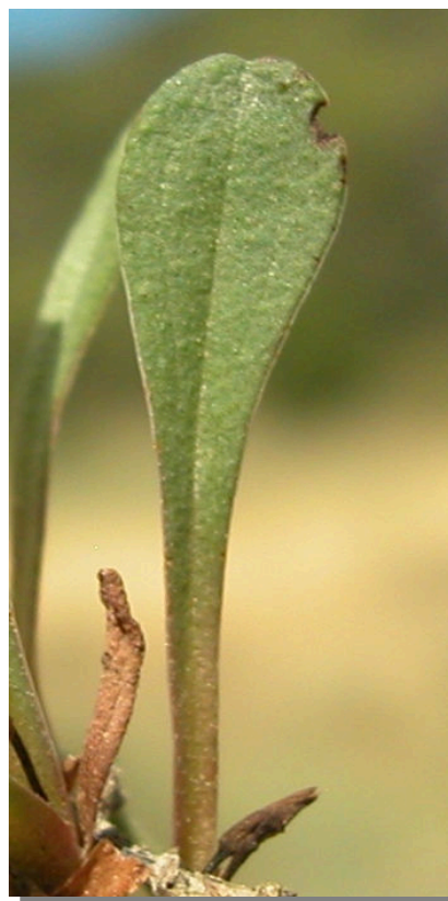
L. hibericum . Detalle de la hoja antes de la floración: haz