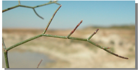
L. hibericum . Detalle de rama estéril