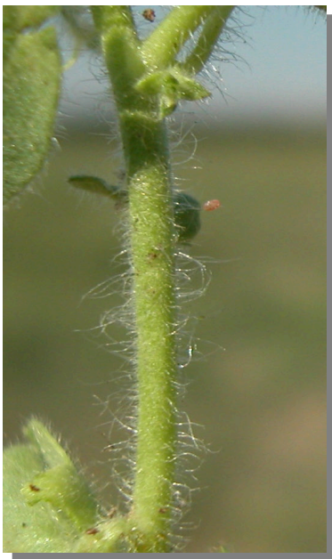
K. elatine . Detalle del tallo