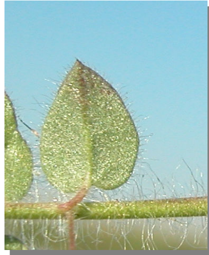
K. elatine . Detalle de una hoja ovada: envés