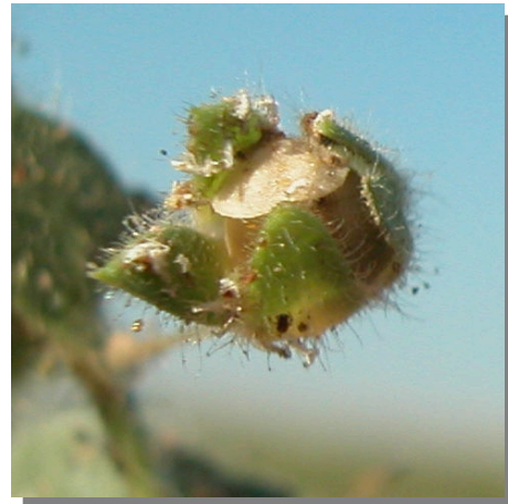
K. elatine . Detalle de la cápsula