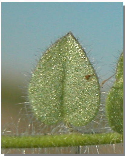
K. elatine . Detalle de una hoja ovada: haz