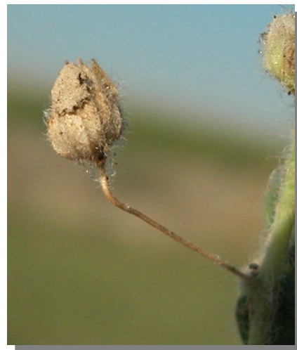
K. elatine . Detalle de la cápsula madura