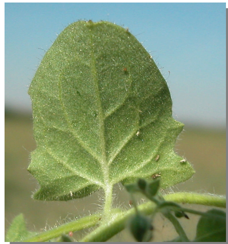
K. elatine . Detalle de una hoja sagitada: envés