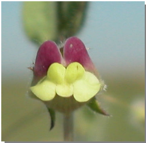
K. elatine . Detalle de los labios de la corola