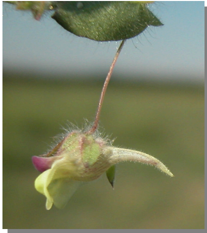
K. elatine . Detalle de una flor