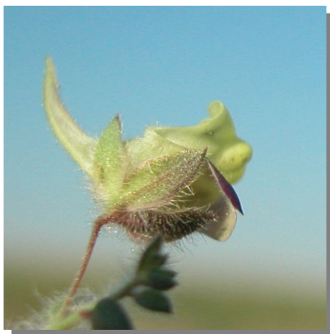
K. elatine . Detalle del cáliz