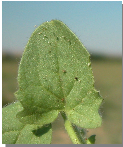
K. elatine . Detalle de una hoja sagitada: