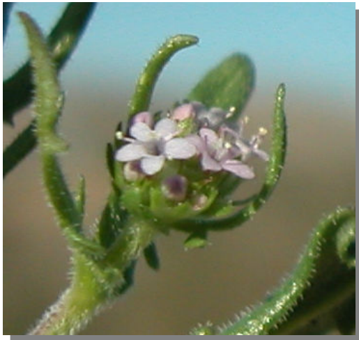
V. discoidea . Detalle de la inflorescencia