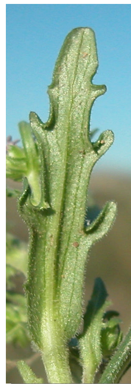
V. discoidea . Detalle de la hoja: envés