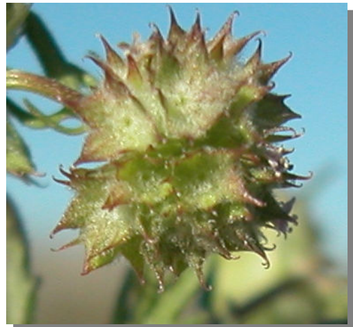
V. discoidea . Detalle de los frutos