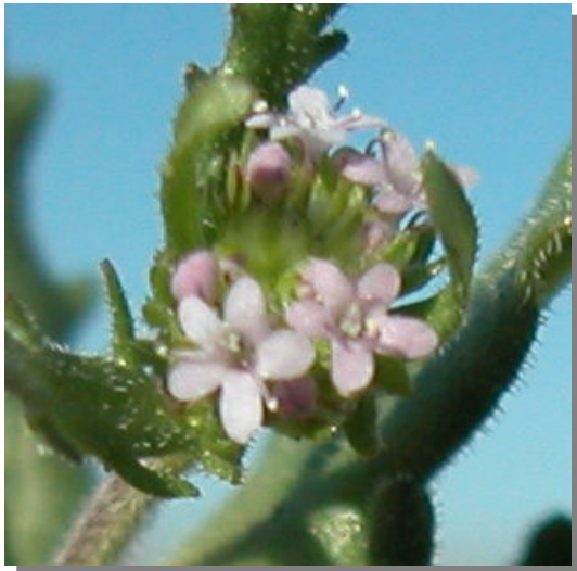
V. discoidea . Detalle de la inflorescencia