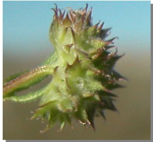
V. discoidea . Detalle de los frutos