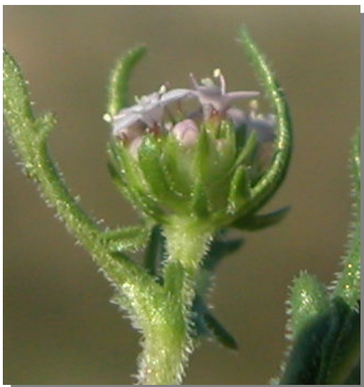
V. discoidea . Detalle de la inflorescencia