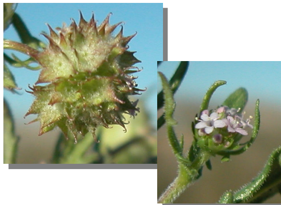
V. discoidea . Detalle de la flor y el fruto.

Fruto igual de largo que de ancho, densamente peloso.