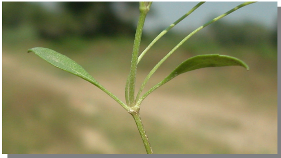
P. filiformis . Detalle de las hojas