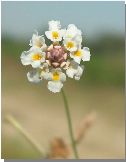
P. filiformis . Detalle de cabezuela floral