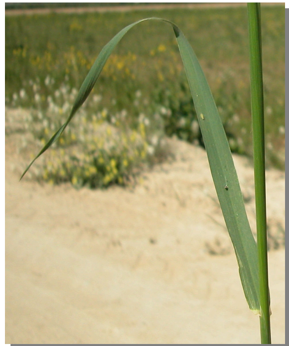
A. barbata . Detalle de la hoja: haz