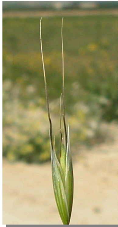
A. barbata . Detalle de la espiquilla