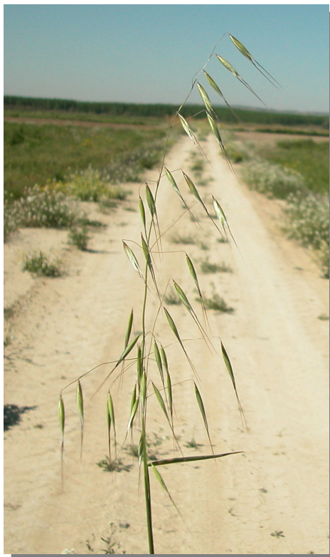
A. barbata . Detalle de la inflorescencia