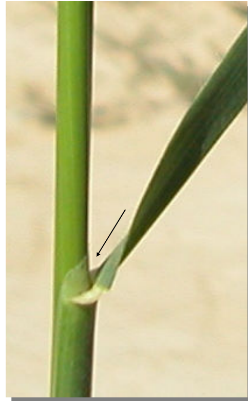
A. barbata . Detalle de la lígula