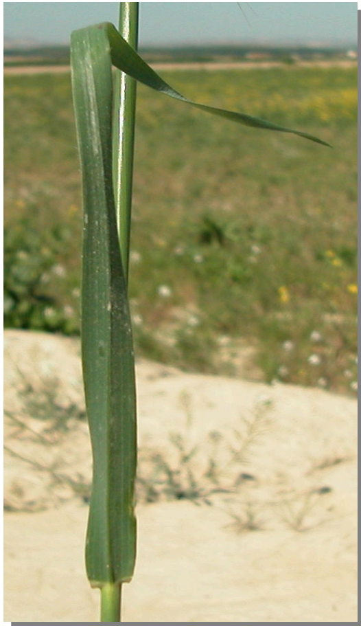
A. barbata . Detalle de la hoja: envés