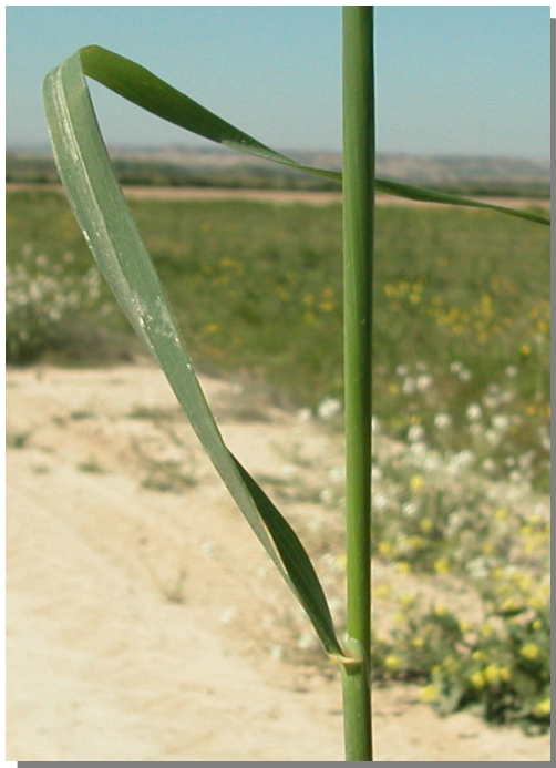
A. barbata . Detalle del tallo