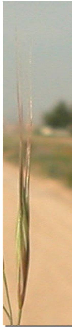
B. diandrus . Detalle de la espiguilla