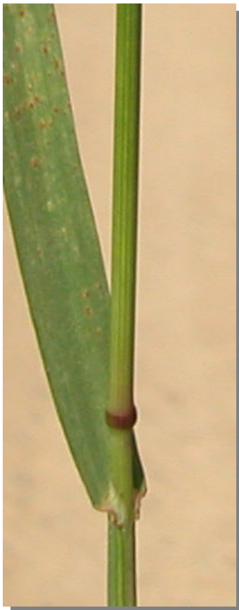
B. diandrus . Detalle del tallo