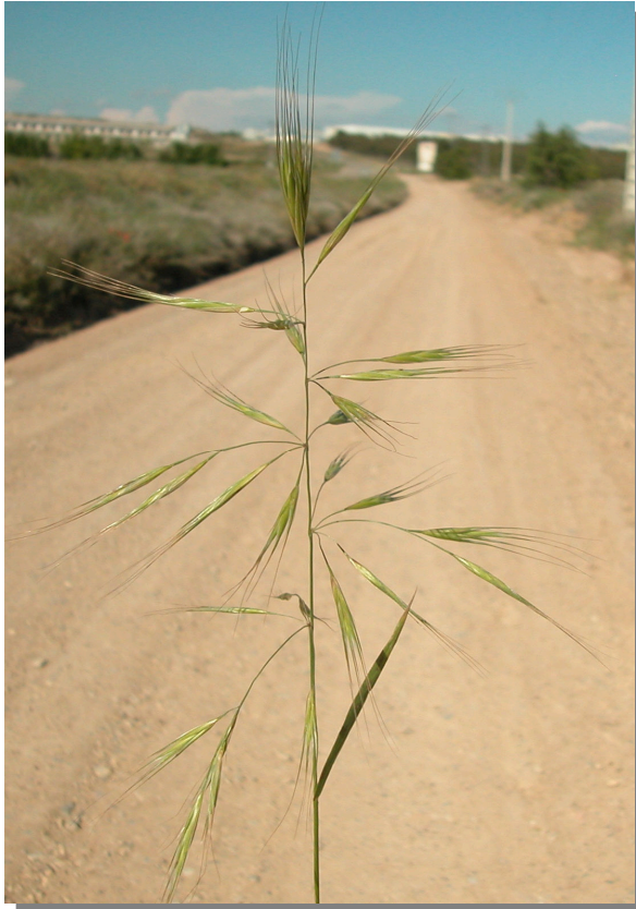
B. diandrus . Detalle de la inflorescencia