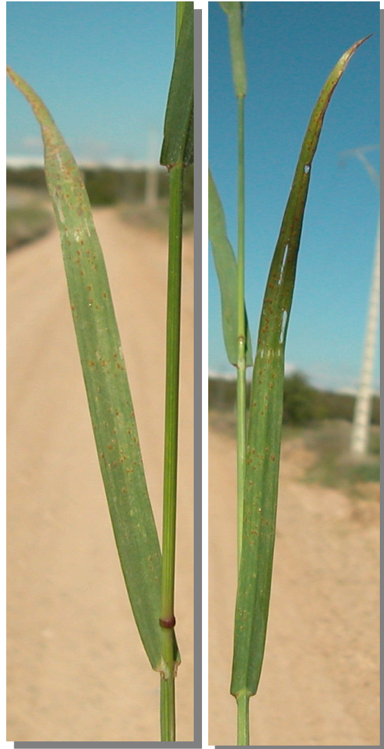
B. diandrus . Detalle de la hoja: haz y envés