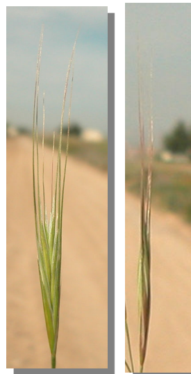
B. diandrus. Detalle de la espiguilla

Gluma inferior con 1 nervio, la superior con 3.