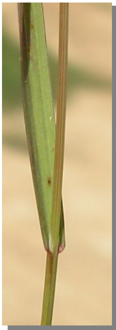
B. madritensis . Detalle del tallo