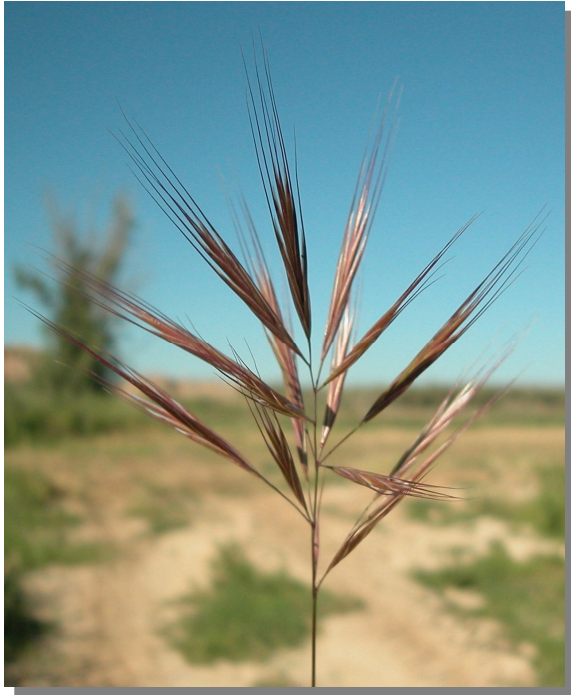
B. madritensis . Detalle de la inflorescencia