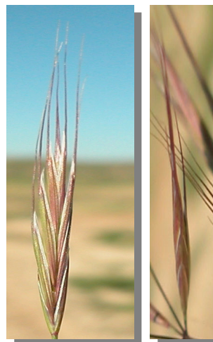
B. madritensis . Detalle de la espiguilla

Lemas de 3-3,5 mm de anchura, terminados en una arista de la misma o mayor longitud.