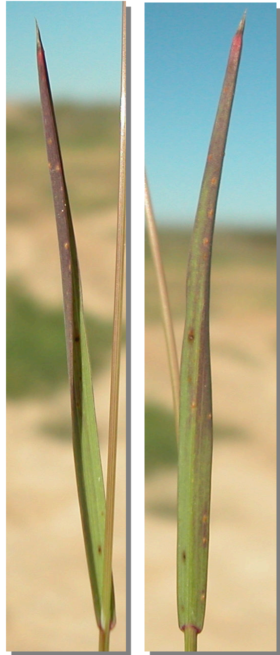
B. madritensis . Detalle de la hoja: haz y envés