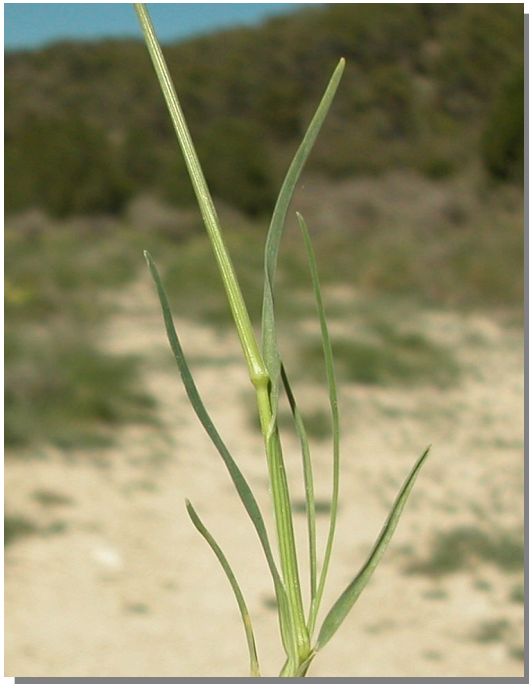
E. capitata . Detalle del tallo y hojas inferiores