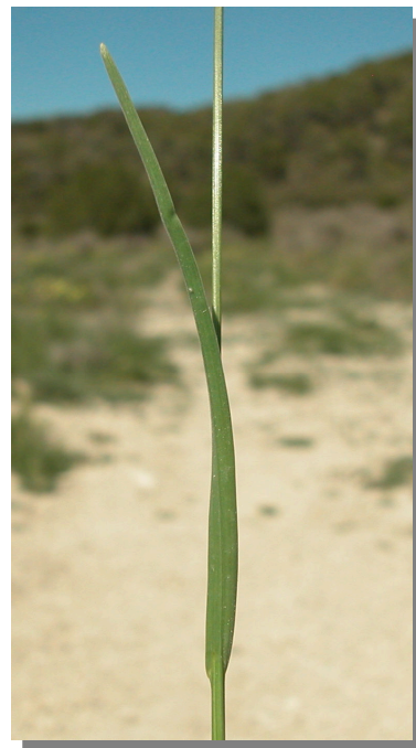
E. capitata . Detalle de una hoja: envés