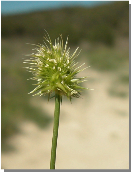
E. capitata . Detalle de la inflorescencia