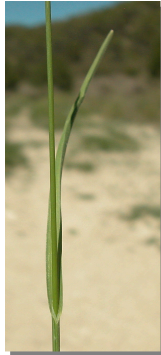
E. capitata . Detalle de una hoja: haz