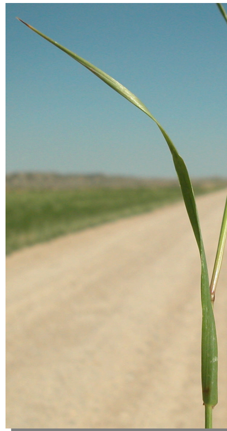
E. repens . Detalle de la hoja: envés