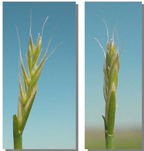
E. repens . Detalle de la espiguilla