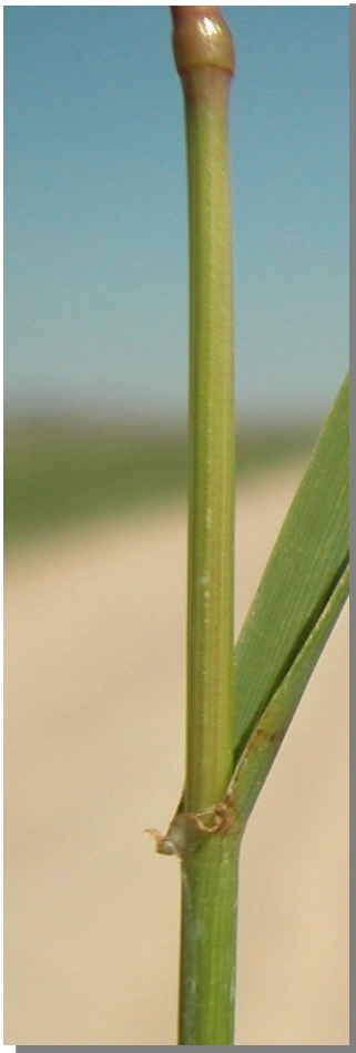
E. repens . Detalle del tallo