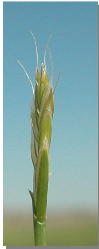
E. repens . Detalle de la espiguilla