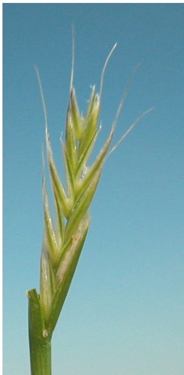
E. repens . Detalle de la espiguilla