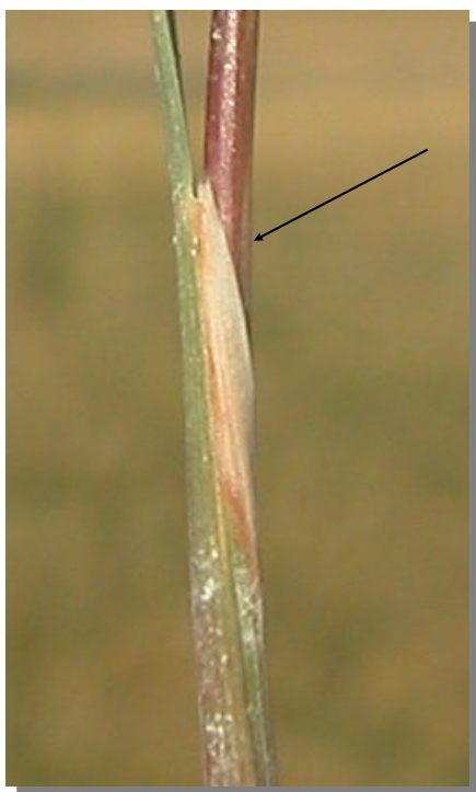
K. vallesiana . Detalle de la lígula