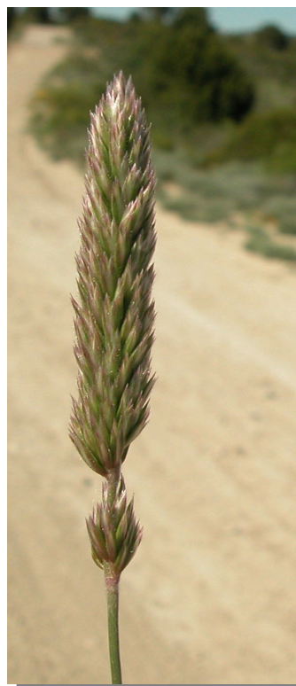
K. vallesiana . Detalle una inflorescencia inmadura