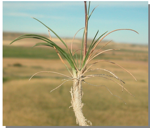
K. vallesiana . Detalle de la base del tallo

Agropyro cristati-Lygeetum sparti Helianthemetum squamati Lepidietum subulati Lygeo sparti-Stipetum lagascae Ononidetum tridentatae Rhamno lycioides-Quercetum cocciferae Rosmarino officinali-Linetum suffruticosi Ruto angustifoliae-Brachypodietum retusi Salsolo vermiculatae-Artemisietum herba-albae Salsolo vermiculatae-Peganetum harmalae Sideritetum cavanillesii Suaedetum verae