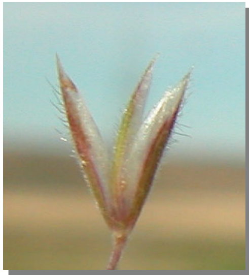
K. vallesiana . Detalle una espiguilla