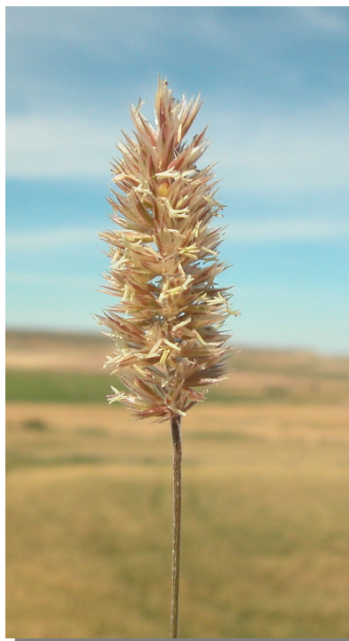
K. vallesiana . Detalle la inflorescencia