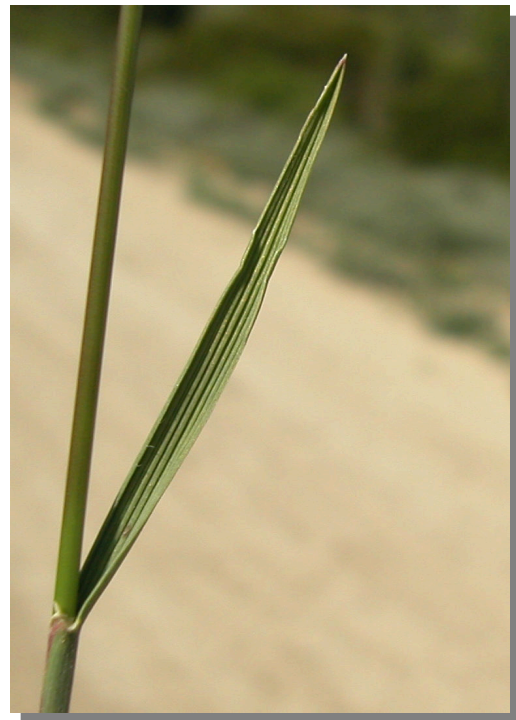
K. vallesiana . Detalle de la hoja: haz