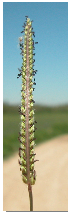
P. dilatatum . Detalle de una espiga