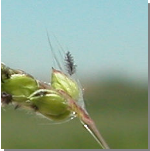
P. dilatatum . Detalle de una espiguilla