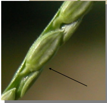
P. distichium . Espigas con el eje floral muy corto y gluma sin pelos