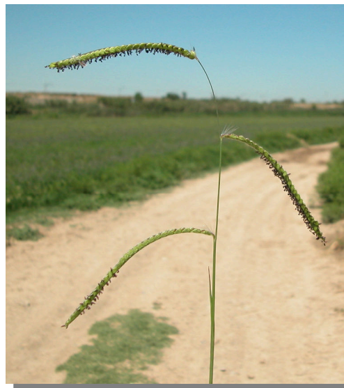
P. dilatatum . Detalle de la inflorescencia