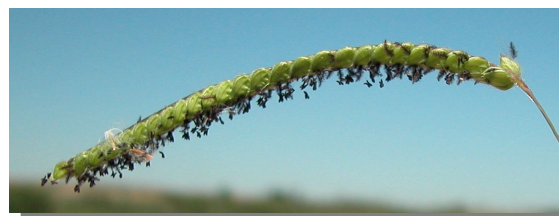
P. dilatatum . Detalle de una espiga