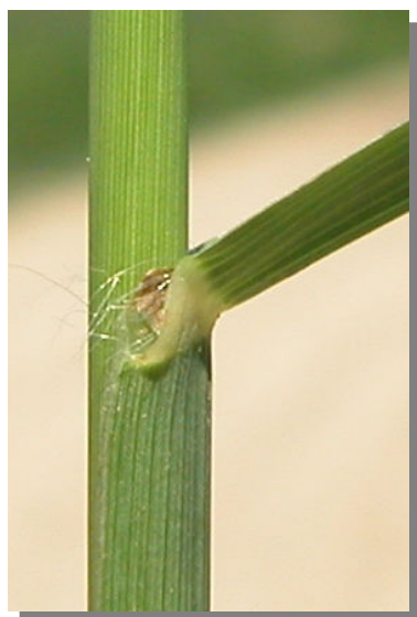
P. dilatatum . Detalle de la vellosidad en la vaina de la hoja