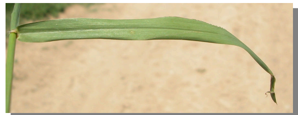
P. dilatatum . Detalle de la hoja: haz