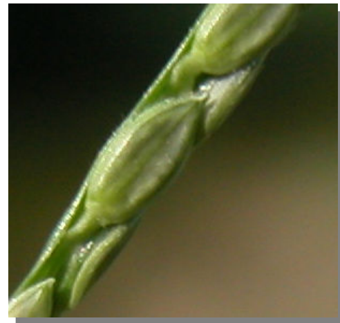
P. distichum . Detalle de la espiguilla