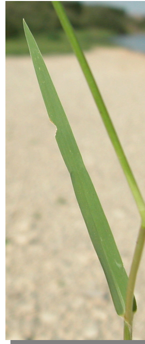
P. distichum . Detalle de la hoja: haz