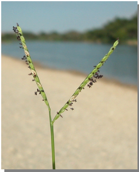
P. distichum . Detalle de la inflorescencia