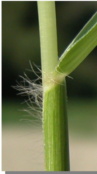
P. distichum . Detalle de la vellosidad en la vaina de la hoja