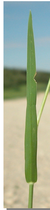
P. distichum . Detalle de la hoja: envés