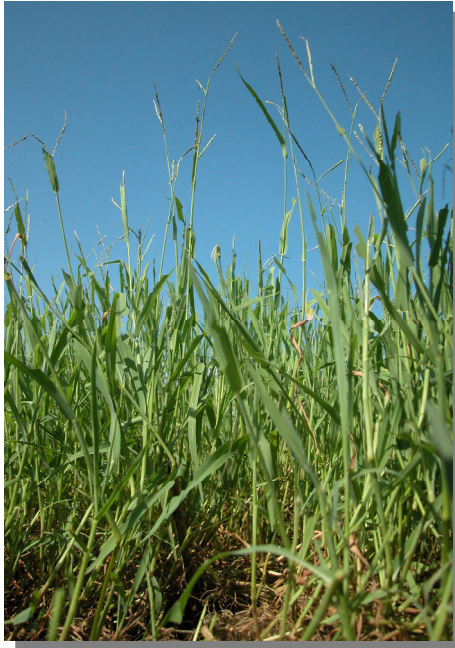
Los Nidos, Pina de Ebro (04/08/2013)