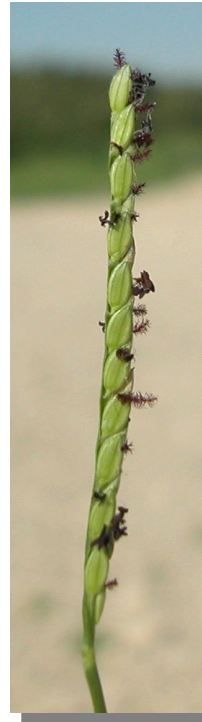
P. distichum . Detalle de una espiga