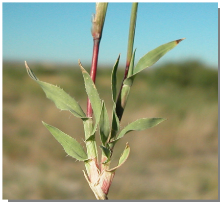
T. racemosus . Detalle de las hojas basales