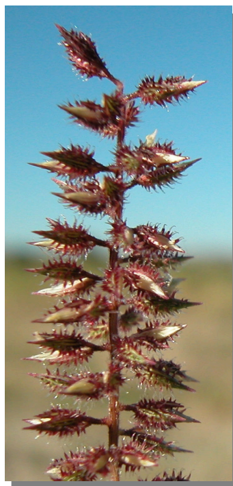
T. racemosus . Detalle de las espiguillas