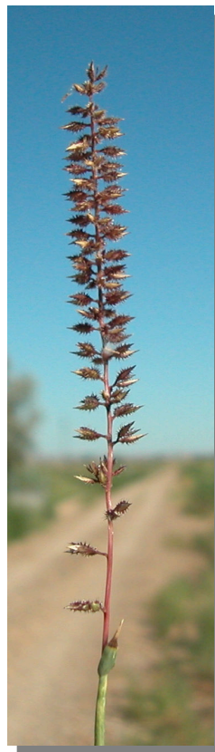
T. racemosus . Detalle de inflorescencia ma- dura