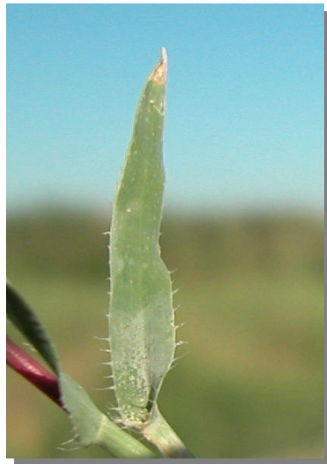
T. racemosus . Detalle de hoja superior: haz