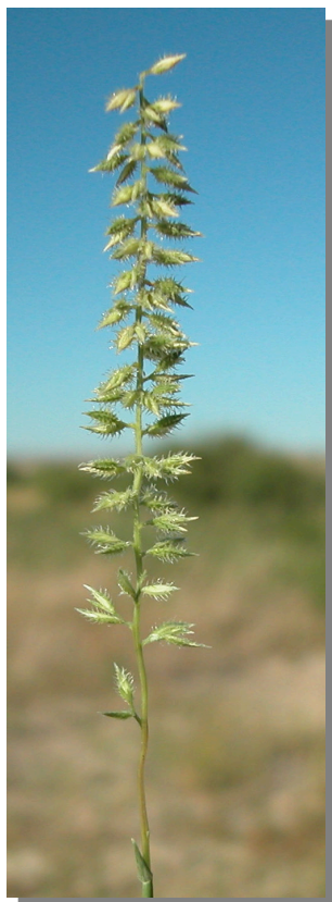
T. racemosus . Detalle de inflorescencia ju- venil