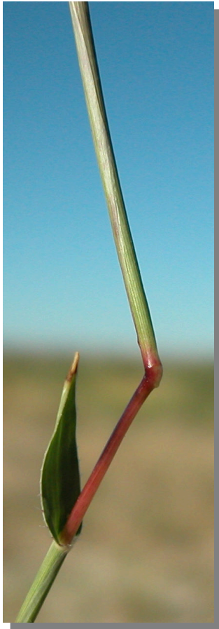
T. racemosus . Detalle del tallo