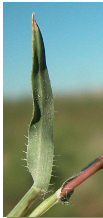
T. racemosus . Detalle de hoja superior: envés