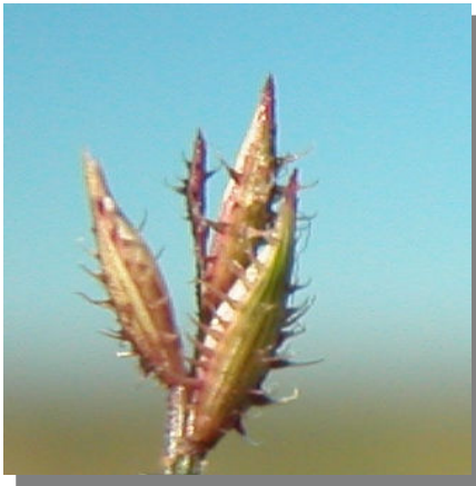
T. racemosus . Detalle de las espiguillas