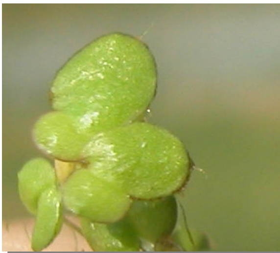
L. gibba . Vista superior del fronde.