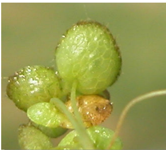
L. gibba . Vista inferior del fronde.