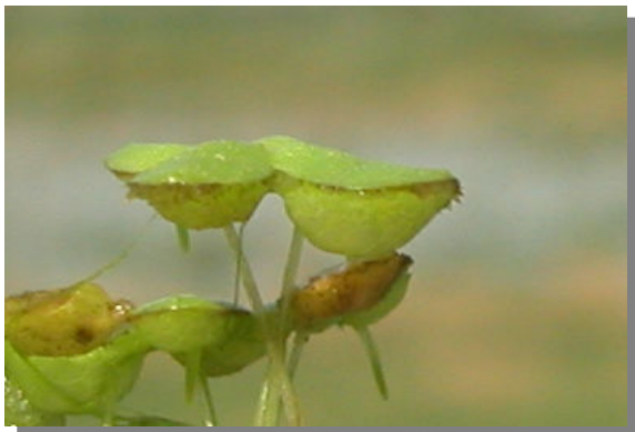
L. gibba . Vista lateral del fronde.