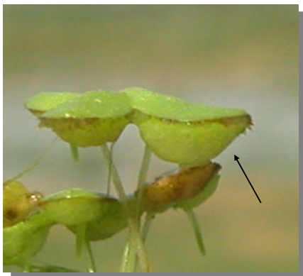
L. gibba. Vista lateral del fronde.

2-6 mm. Planta flotante; frondes orbiculares o abovados, gibosos en la parte inferior, a veces rojizos en los bordes; raíces de hasta 9 cm; inflorescencia de 0,8-1 mm.