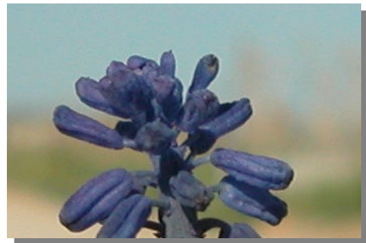
M. neglectum . Detalle de las flores estériles