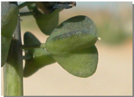
M. neglectum . Detalle del fruto