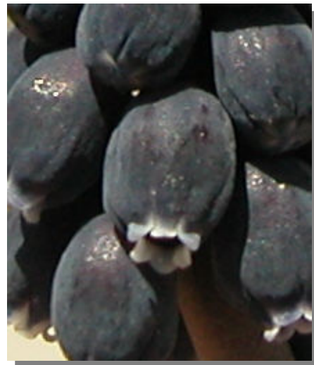
M. neglectum . Detalle de una flor fértil