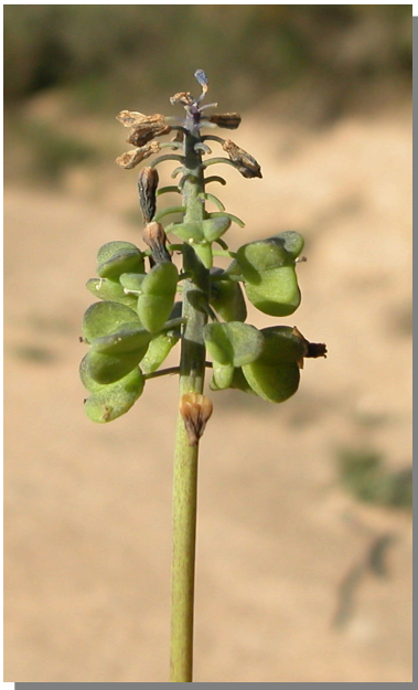
M. neglectum . Detalle de una planta fructificada