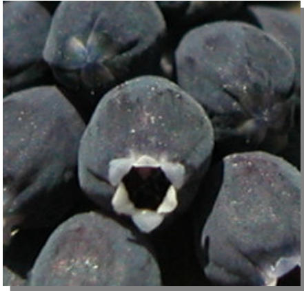
M. neglectum . Detalle de una flor fértil