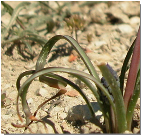
M. neglectum . Detalle de las hojas