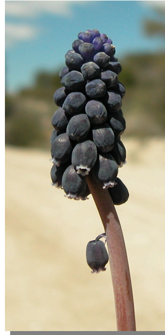
M. neglectum . Detalle de la inflorescencia