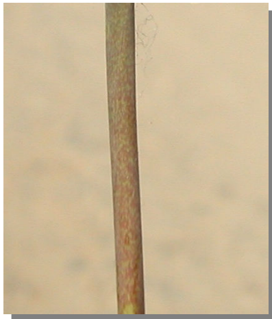
M. neglectum . Detalle del tallo