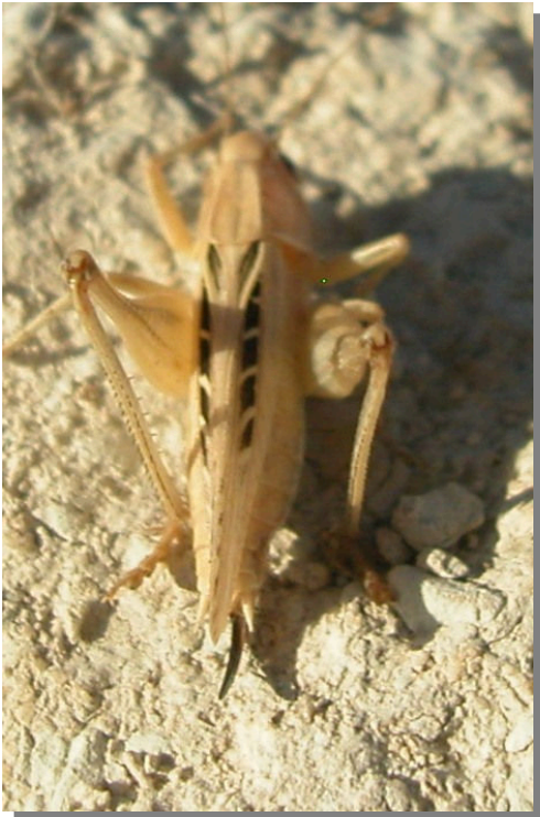
P. tessellata . Hembra