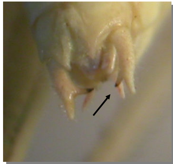
P. tessellata . Macho: cercos con diente interno situado más cerca del ápice que del centro

Área radial de las tegminas ensanchada y de coloración muy contrastada, con el fondo oscuro y venas transversales muy claras. Hembra con la placa subgenital con un surco ancho. Hembra con el séptimo esternito proyectándose distalmente como un diente. Macho con diente interno situado más cerca del ápice que de la mitad del cerco. Ovopositor corto y bruscamente curvado hacia arriba desde la base.