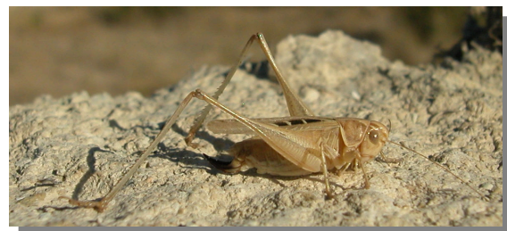
P. tessellata . Hembra