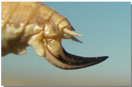
P. tessellata . Determinación del sexo. Presencia de ovopositor: arriba macho; abajo hembra con ovopositor corto y bruscamente curvado hacia arriba desde la base