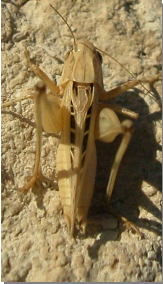
P. tessellata . Macho