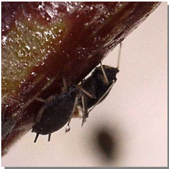
A. hederae . Sobre yedra ( Hedera helix )