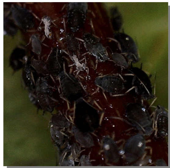
A. hederae . Sobre yedra ( Hedera helix )