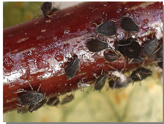
A. hederae . Sobre yedra ( Hedera helix )