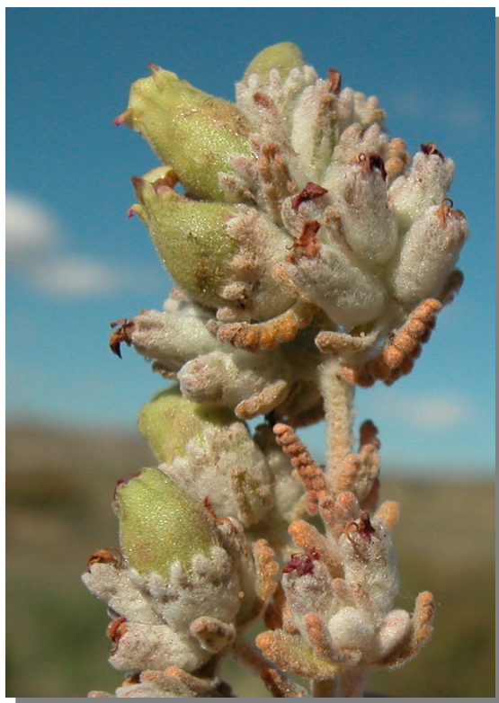
C. teucris . Agallas en Teucrium gnaphalodes . La Retuerta. Pina de Ebro (26/05/14)