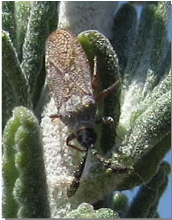
C. teucris .