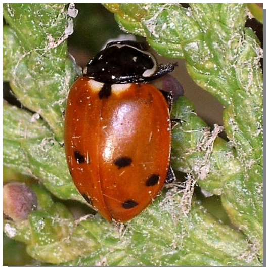
Vireta; Pina de Ebro (26/06/2016)