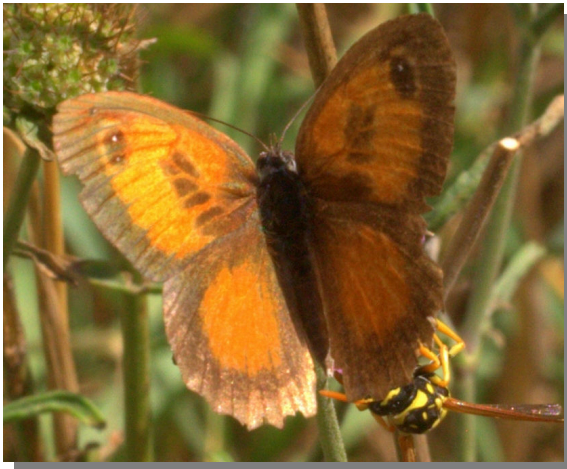
P. cecilia . Macho