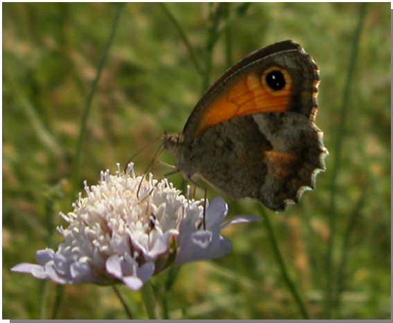
P. cecilia .