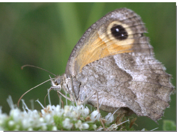
P. cecilia .