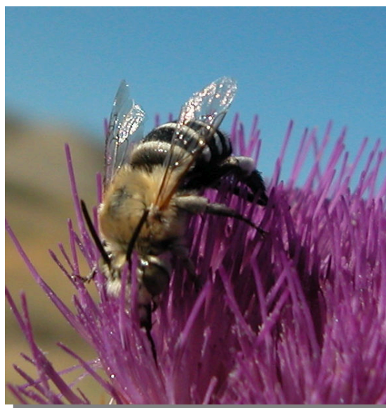
M. bidens . Hembra