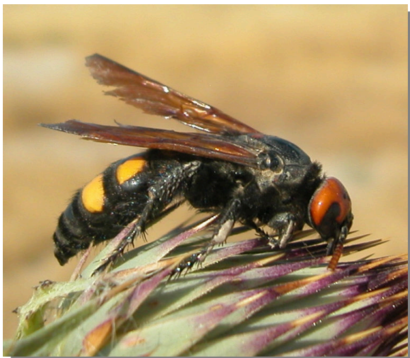
Farlé; Pina de Ebro (26/06/2016). Hembra