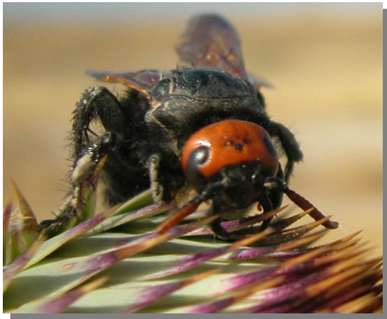
M. bidens . Hembra