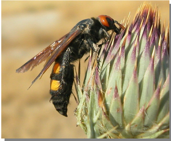
M. bidens . Hembra