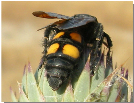
M. bidens . Hembra