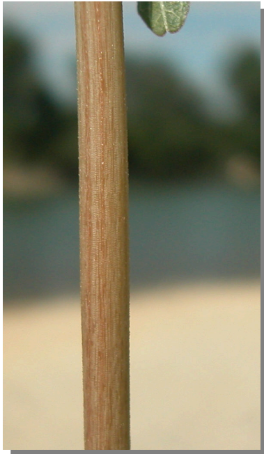
A. viridis . Detalle del tallo.