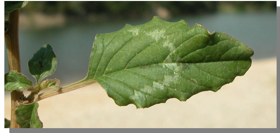
A. viridis . Detalle de una hoja: haz