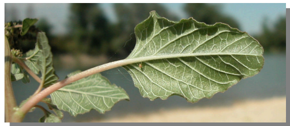
A. viridis . Detalle de una hoja: envés