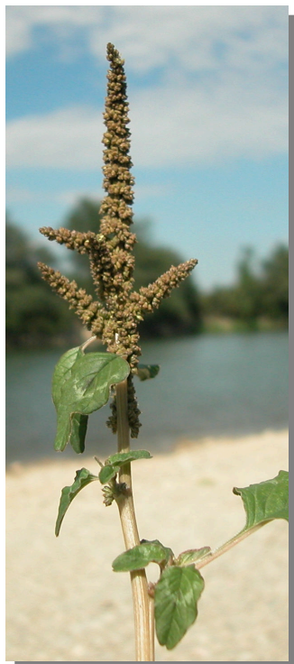
A. viridis . Detalle de una rama