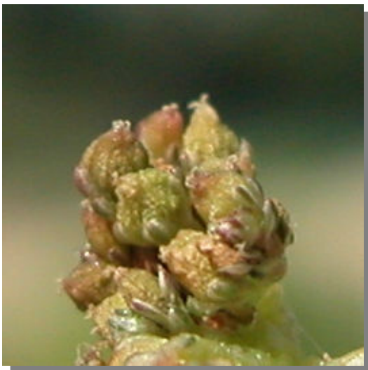
A. viridis . Detalle del fruto