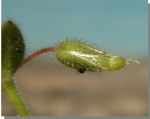
C. pumilum . Detalle del fruto