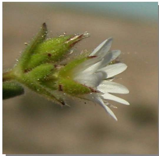
C. pumilum . Detalle de la flor