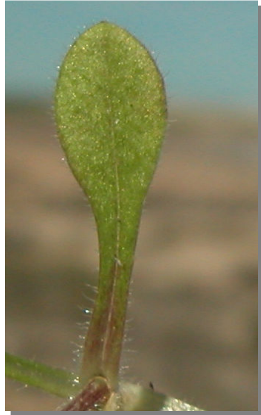
C. pumilum . Detalle de hoja inferior: haz