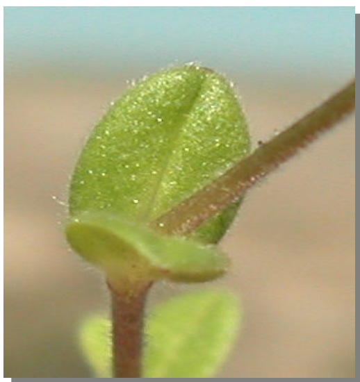
C. pumilum . Detalle de hoja superior: haz