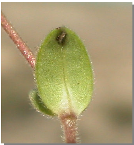
C. pumilum . Detalle de hoja superior: envés