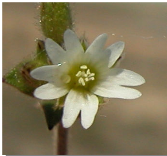
C. pumilum . Detalle de la corola