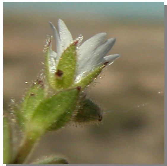
C. pumilum . Detalle de las brácteas, sépalos y pétalos.