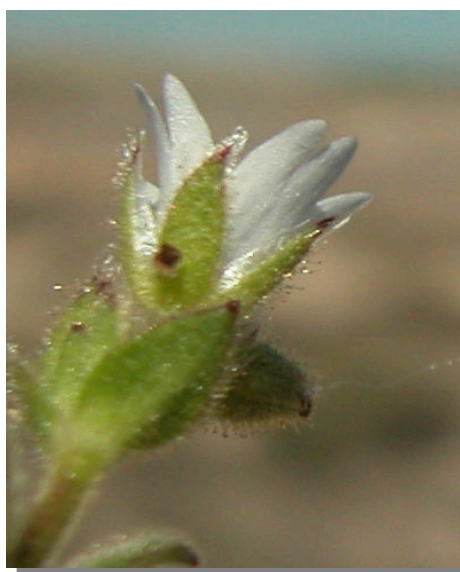
C. pumilum . Detalle del cáliz