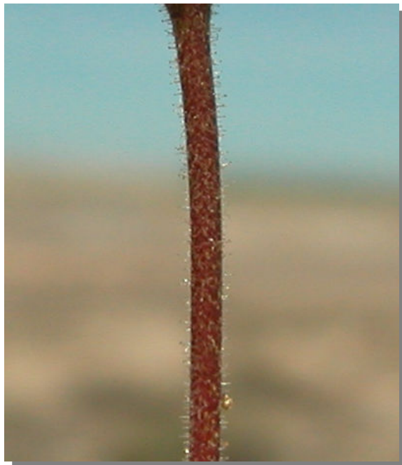
C. pumilum . Detalle del tallo