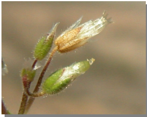
C. pumilum . Detalle del fruto