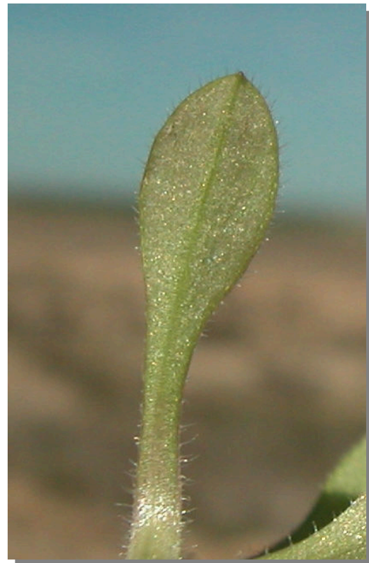
C. pumilum . Detalle de hoja inferior: envés