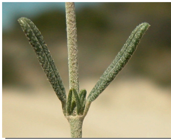
H. violaceum . Detalle de las hojas