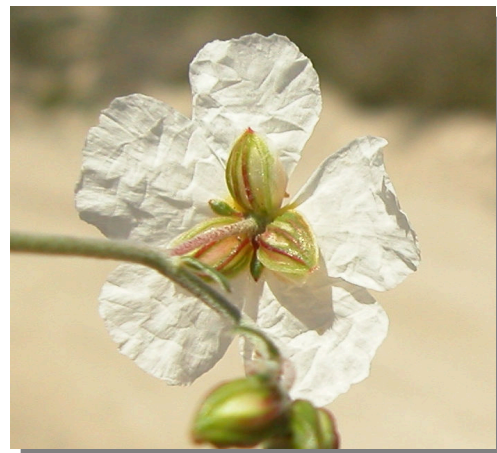
H. violaceum . Detalle del cáliz