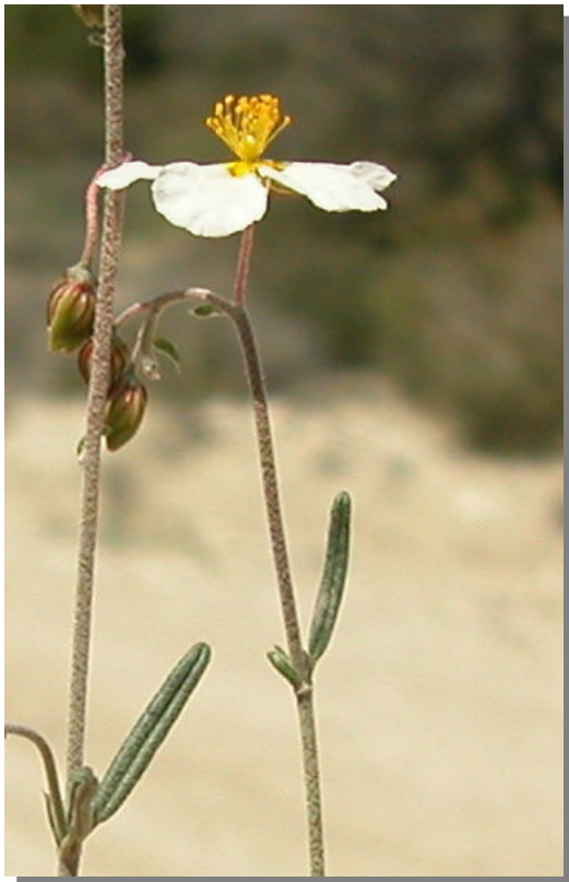
H. violaceum . Detalle de la inflorescencia