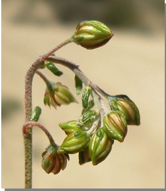
H. violaceum . Detalle de la cápsula inmadura