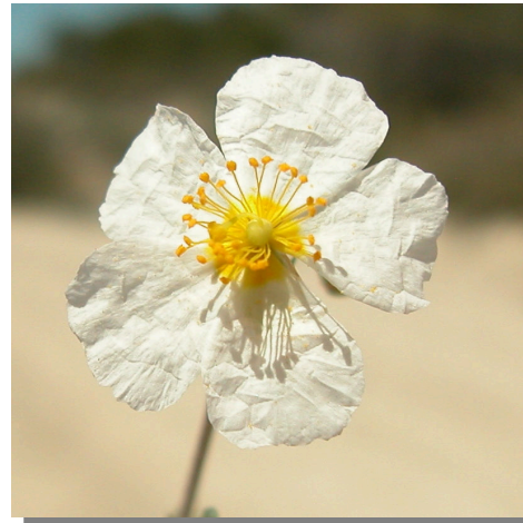
H. violaceum . Detalle de la corola