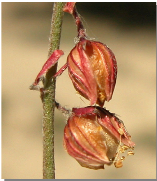
H. violaceum . Detalle de la cápsula madura