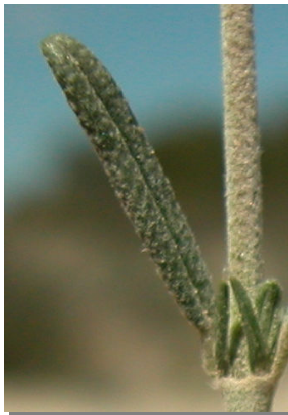
H. violaceum . Detalle de la hoja: haz