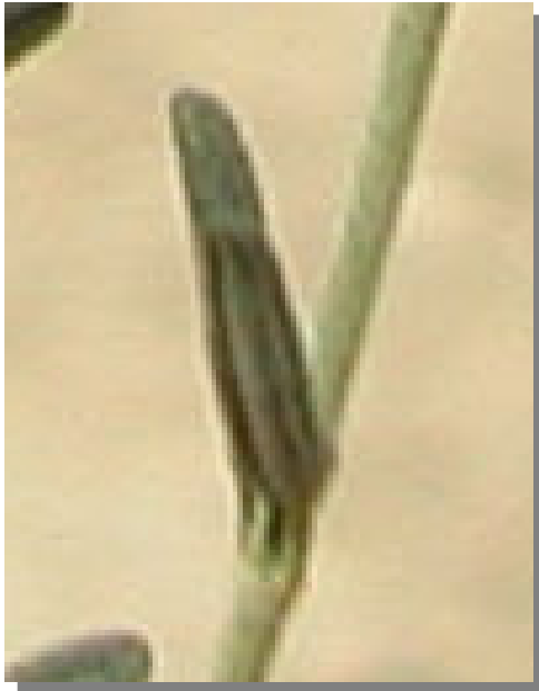
H. violaceum . Detalle de la hoja: envés