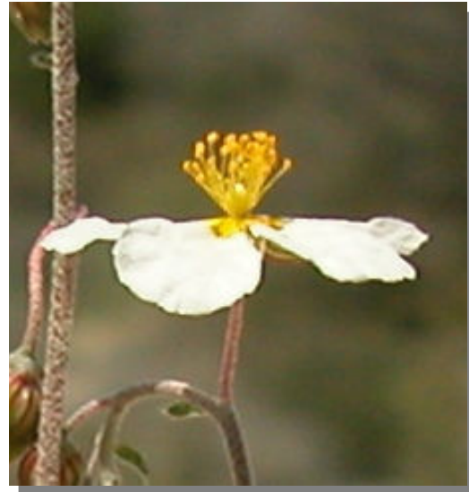
H. violaceum . Detalle de la flor