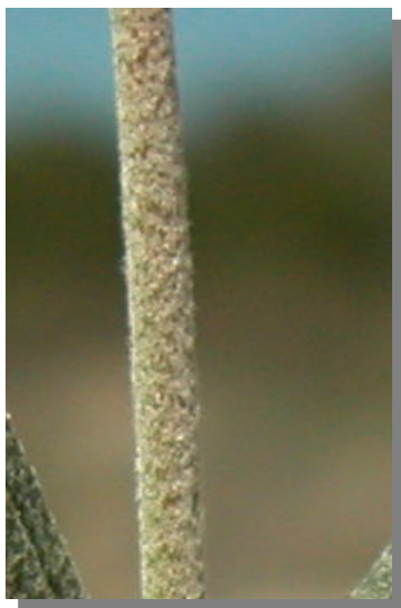
H. violaceum . Detalle del tallo