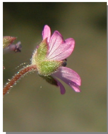
G. molle . Detalle del cáliz