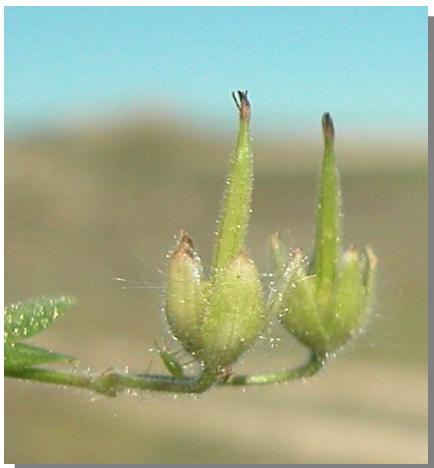
G. molle . Detalle de frutos inmaduros