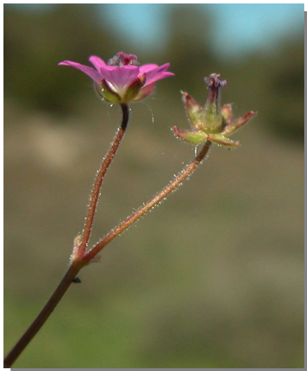
G. molle . Detalle de la inflorescencia