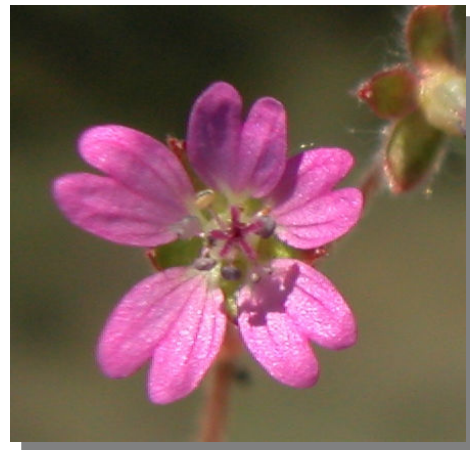
G. molle . Detalle de la corola