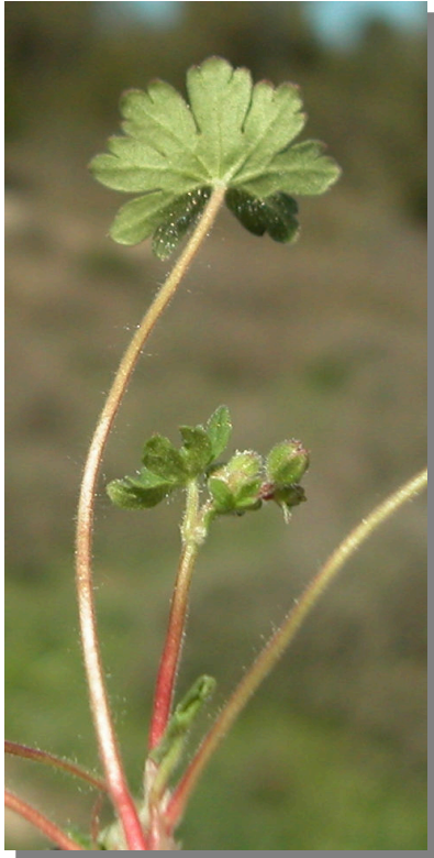
G. molle . Detalle de la hoja inferior: envés