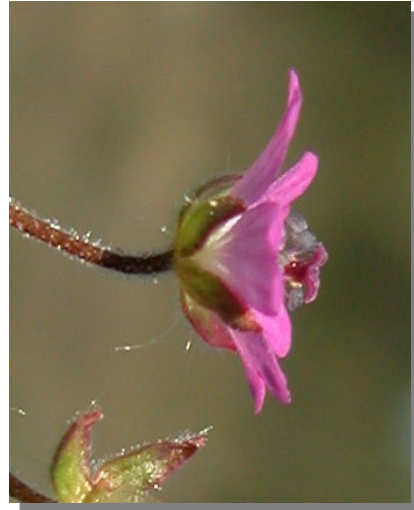
G. molle . Detalle de la flor