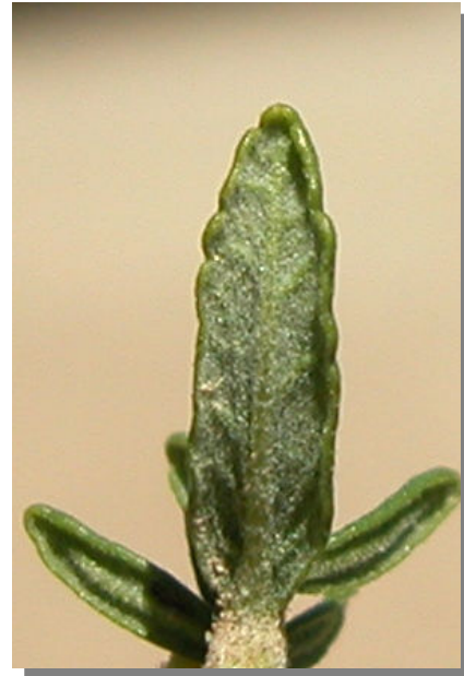
T. aragonense . Detalle de la hoja: envés