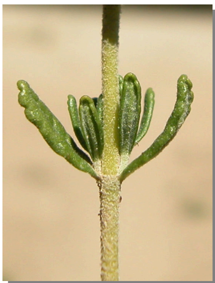
T. aragonense . Detalle del tallo y hojas