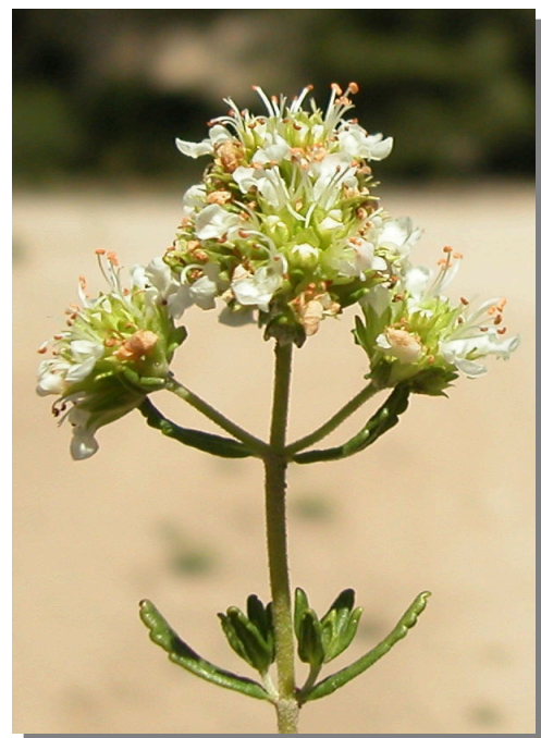
T. aragonense . Detalle de la inflorescencia