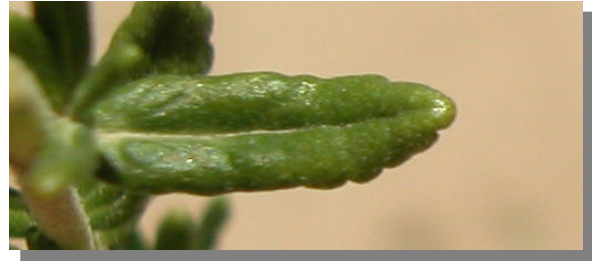
T. aragonense . Detalle de la hoja: haz