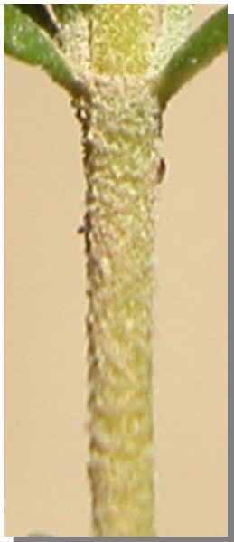
T. aragonense . Detalle del tallo