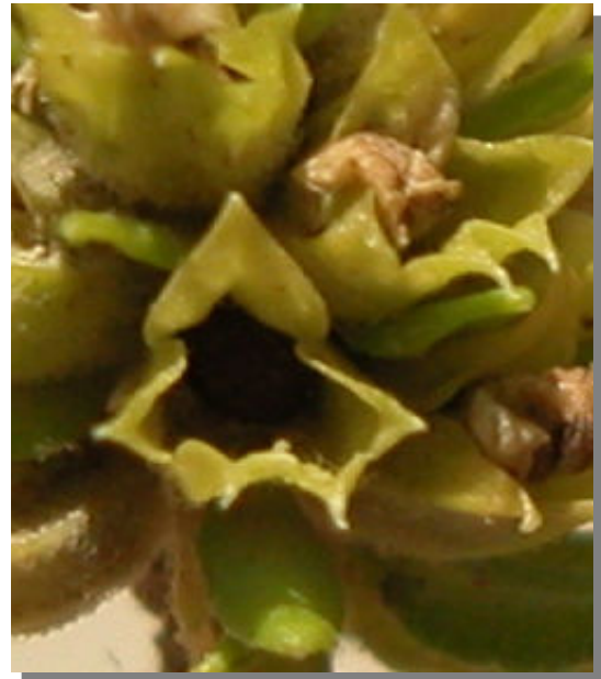
T. aragonense . Detalle del cáliz tras la floración