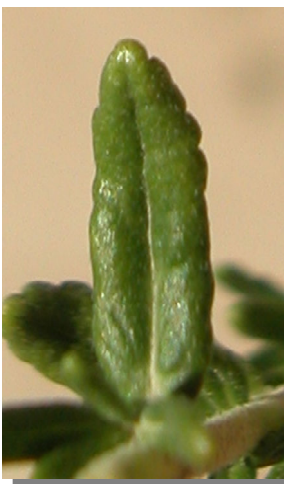
T. aragonense. Detalle de la flor y la hoja.