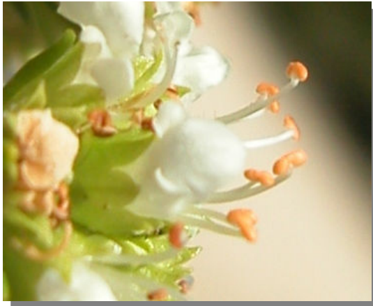
T. aragonense . Detalle de la flor