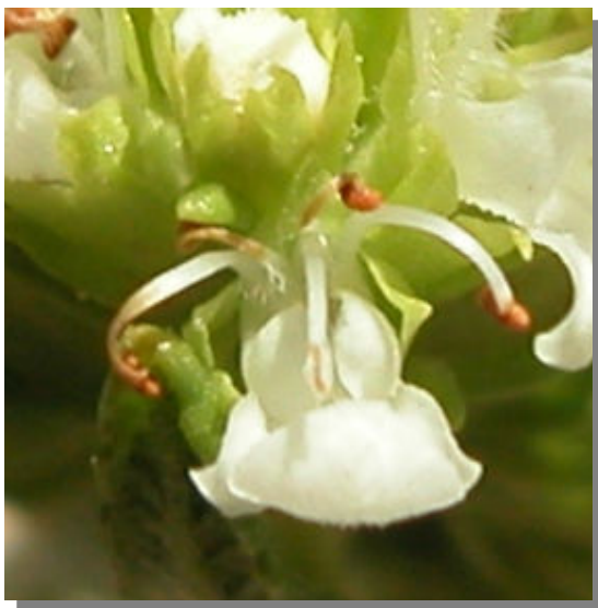
T. aragonense . Detalle de la corola