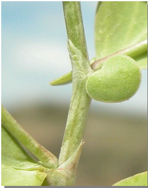
C. scorpioides . Detalle del tallo y estípulas