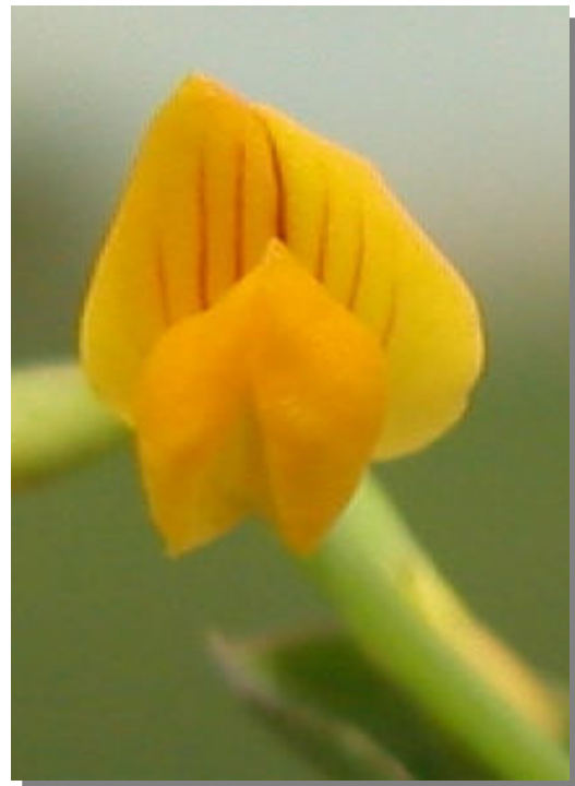
C. scorpioides . Detalle de la corola