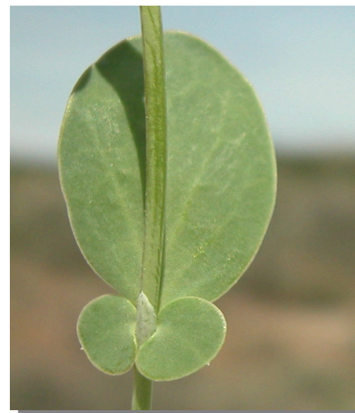
C. scorpioides . Detalle de hoja superior: haz