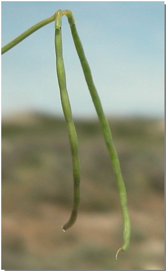
C. scorpioides . Detalle del fruto.