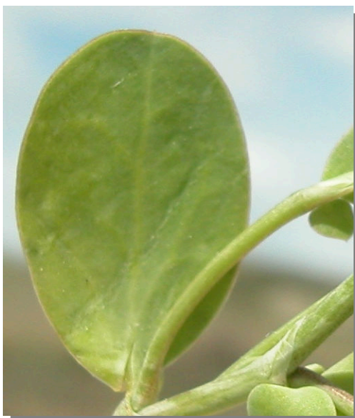
C. scorpioides . Detalle de hoja basal: haz