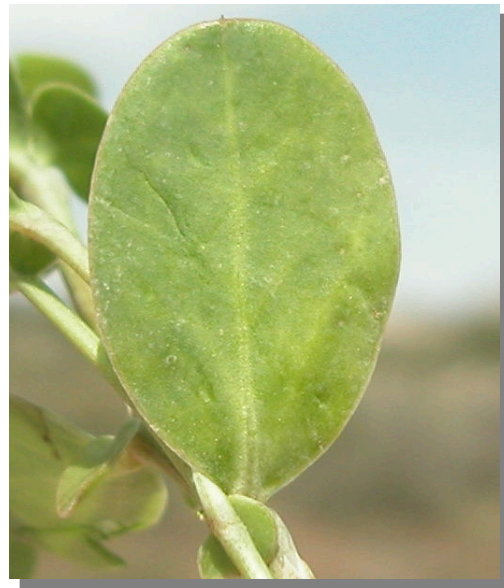
C. scorpioides . Detalle de hoja basal: envés