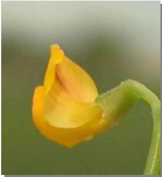
C. scorpioides . Detalle del cáliz