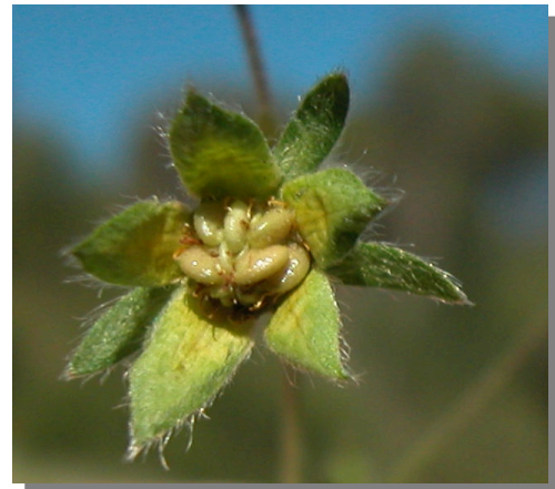
P. neumanniana . Detalle del fruto