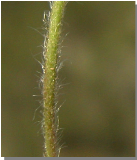
P. neumanniana . Detalle del tallo