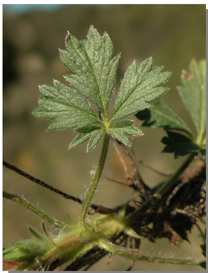
P. neumanniana . Detalle de una hoja: haz