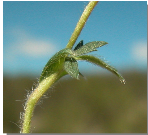
P. neumanniana . Detalle de estípula superior