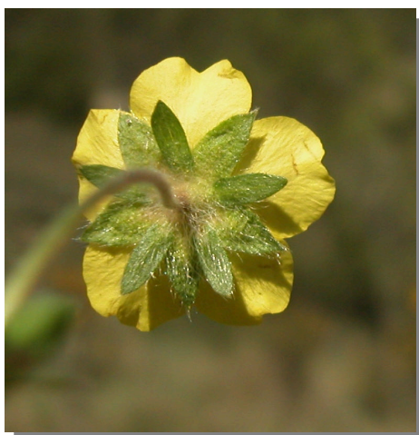
P. neumanniana . Detalle del cáliz y cálculo