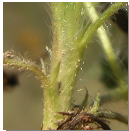
P. neumanniana . Detalle de estípula inferior