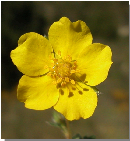
P. neumanniana . Detalle de la corola