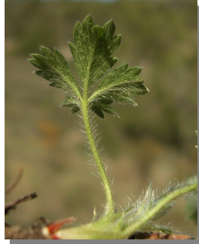
P. neumanniana . Detalle de una hoja: envés