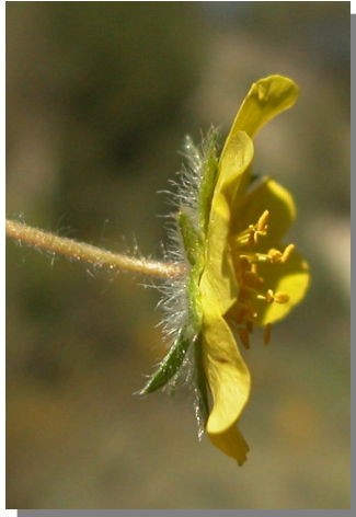
P. neumanniana . Detalle de la flor