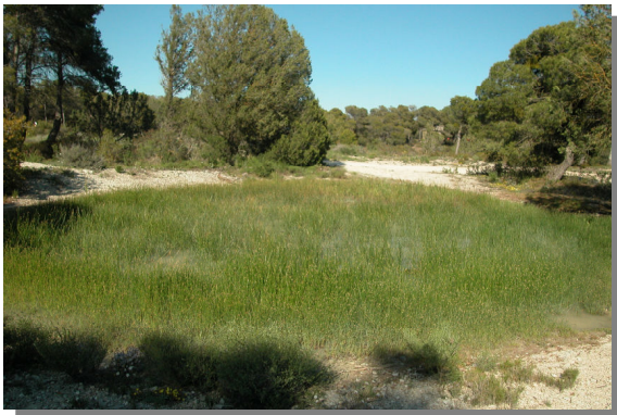
E. palustris en Balsa Miramón.