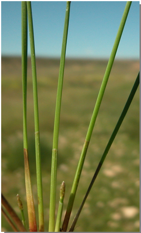
E. palustris . Detalle de los tallos