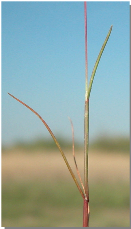
S. divaricatus . Detalle del tallo y hojas