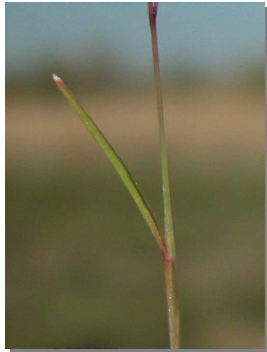
S. divaricatus . Detalle de la hoja