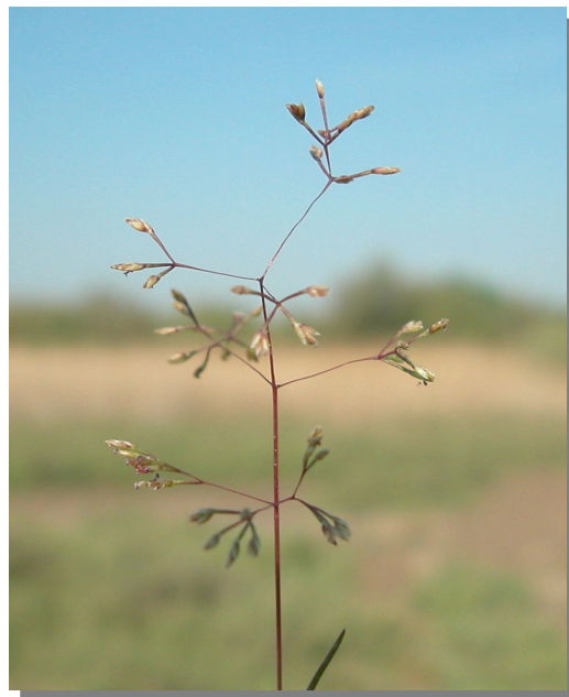
S. divaricatus . Detalle de la espiga