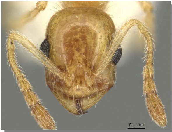
T. blascoi .