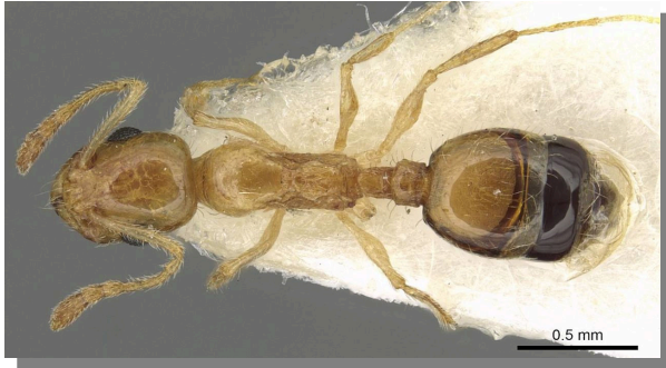
T. blascoi .