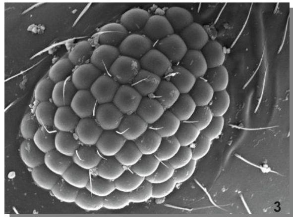
T. blascoi . Detalle del ojo.